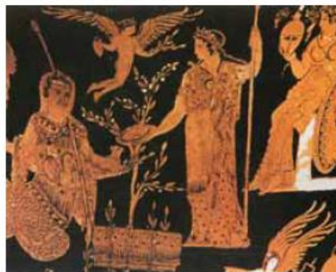
Νίκος & Μαρία Ψιλάκη - Ηλίας Καστανάς, Ο πολιτισμός της ελιάς εκδ. Καρμάνωρ, Ηράκλειο, 1999

Νίκος & Μαρία Ψιλάκη - Ηλίας Καστανάς, Ο πολιτισμός της ελιάς , Εκδόσεις Καρμάνωρ, Ηράκλειο, 1999 (διασκευή)