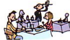
Aller au restaurant