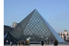
Le musée du Louvre