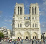
La cathédrale de Paris