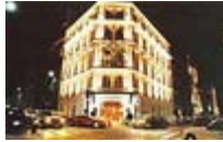
L'hôtel « Madeleine »