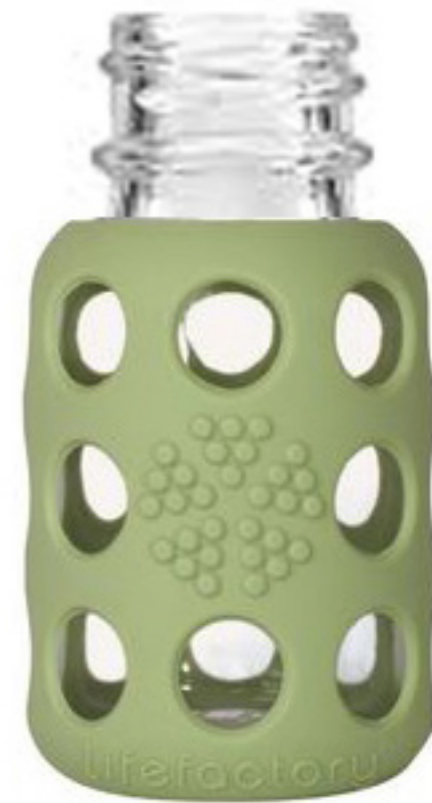
Σχ.2 Γυάλινο μπουκάλι μπιμπερού