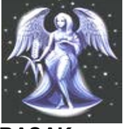
BAŞAK (23 Ağustos- 22 Eylül)

Bugün heyecan verici bir haber alabilir, eski bir dostunuzla karşılaşabilirsiniz. Komşularınızla aranızda çıkabilecek anlaşmazlıkları anlayışlı davranarak çözenizde yarar var. Çok hoş fırsatlarla karşılaşabilir, ilginç teklifler alabilirsiniz. Sevdiğinizin ilgisi artıyor. Her geçen gün sizi daha çok seviyor ve size bağlanıyor.