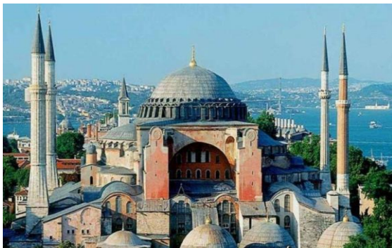
Εικόνα 1: Ναός "της του Θεού Σοφίας" Κωνσταντινούπολη (εξωτερική όψη)