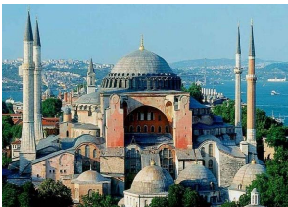
Εικόνα 1: Ναός "της του Θεού Σοφίας" Κωνσταντινούπολη (εξωτερική όψη)