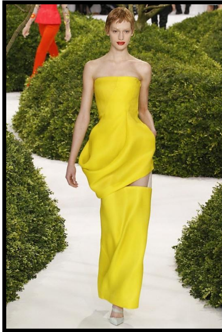
Εικόνα 1: Ένδυμα από τη συλλογή του οίκου Christian Dior για τη Γαλλική Εβδομάδα Μόδας, Haute-Couture, Καλοκαίρι 2013

Να σχολιάσετε και να εξηγήσετε πιο κάτω, τις ιδιότητες των στοιχείων καλαισθησίας, καθώς και τα σημεία στα οποία έχουν χρησιμοποιηθεί για το σχέδιο του ενδύματος στην Εικόνα 1 .