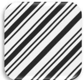
Εικόνα 6: Υφαντό βαμβακερό ύφασμα