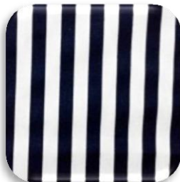
Εικόνα 4: Υφαντό βαμβακερό ύφασμα