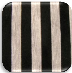
Εικόνα 3: Πλεχτό ύφασμα Τζέρσεϊ

(α) Να σχεδιάσετε ένα καλοκαιρινό φόρεμα το οποίο να είναι ιδανικό για ένα κοντό γυναικείο σώμα με βαρύ σκελετό στο κάτω μέρος.