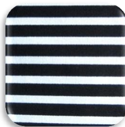
Εικόνα 5: Υφαντό βαμβακερό ύφασμα