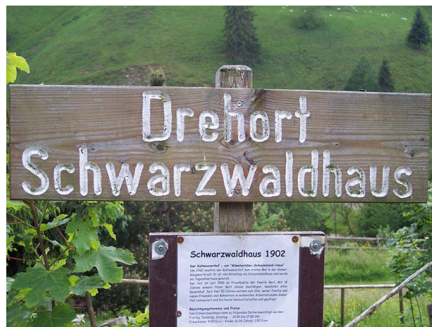
Kaltwasserhof Müntertal - Drehort der SWR-Serie Schwarzwaldhaus 1902