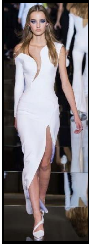
Εικόνα 4: Οίκος: Atelier Versace, για το Καλοκαίρι 2015

(β) Οι Εικόνες 4 και 5 παρουσιάζουν ενδύματα με φανερή τη «συμμετρική» και την «ασύμμετρη» ισορροπία.