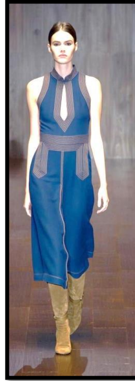
Εικόνα 5: Οίκος: Gucci, για το Καλοκαίρι 2015