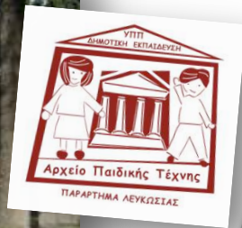
ΛΕΥΚΩΣΙΑ Δημοτικό Σχολείο Αγίου Αντωνίου