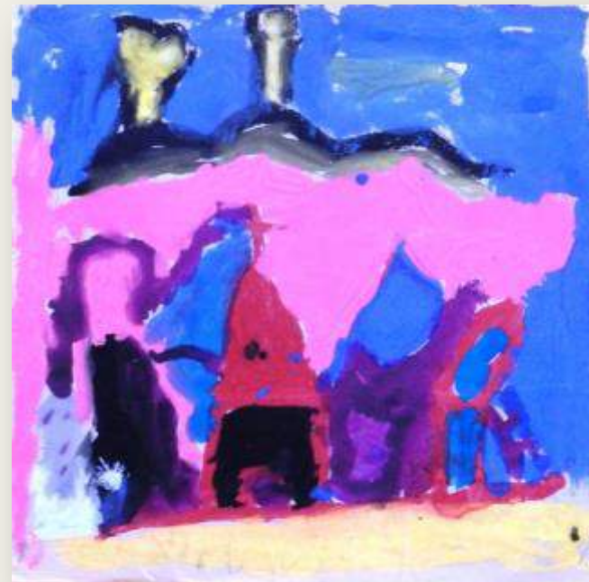
«Αιτίλο» Μαρίνος, 5 ετών 1968