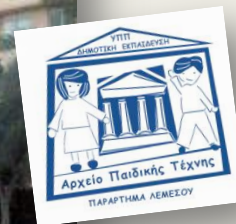
ΛΕΜΕΣΟΣ Α' Δημοτικό Σχολείο Λεμεσού