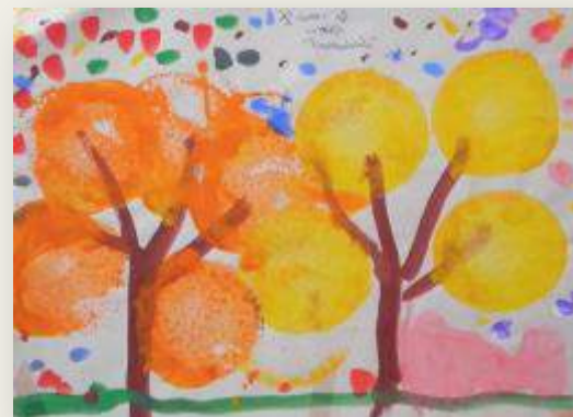
«Εσπεριδοειδή» Φιλοθέη, 5 ετών 1993