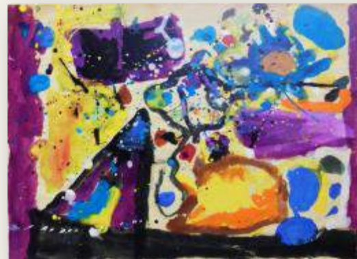
«Άτιτλο» Στέλιος, 6 ετών 1973