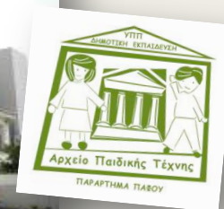
ΠΑΦΟΣ ΙΒ' Δημοτικό Σχολείο Πάφου