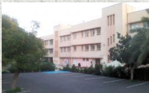
ΛΕΜΕΣΟΣ Α΄ Δημοτικό Σχολείο Λεμεσού