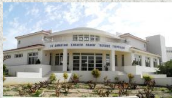
ΠΑΦΟΣ ΙΒ΄ Δημοτικό Σχολείο Πάφου