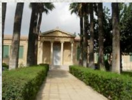
ΛΕΥΚΩΣΙΑ Δημοτικό Σχολείο Αγ. Αντωνίου