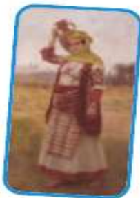
«Χωρική της Αττικής», ελαιογραφία σε καμβά, Γαλλική Σχολή, 19ος αι.