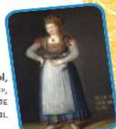
J.E.Liotarol, «Κόρη της Χίου», ελαιογραφία σε καμβά, 18ος αι.