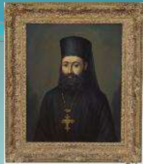
M. Anselme , «Προσωπογραφία Αρχιεπισκόπου Κυπριανού», ελαιογραφία σε καμβά, 1966