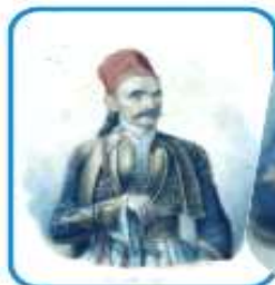
Carl Krazeisen, «Κωνσταντίνος Μπότσαρης», 19ος αι.