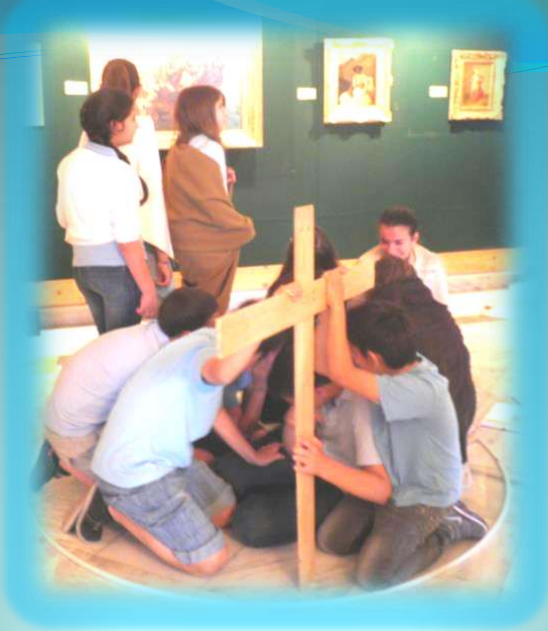
Αναπαράσταση του πίνακα /δραματοποίηση