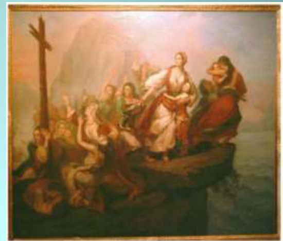
«Ο χορός του Ζαλόγγου» ελαιογραφία σε καμβά, Γαλλική Σχολή, 19 ος αι.