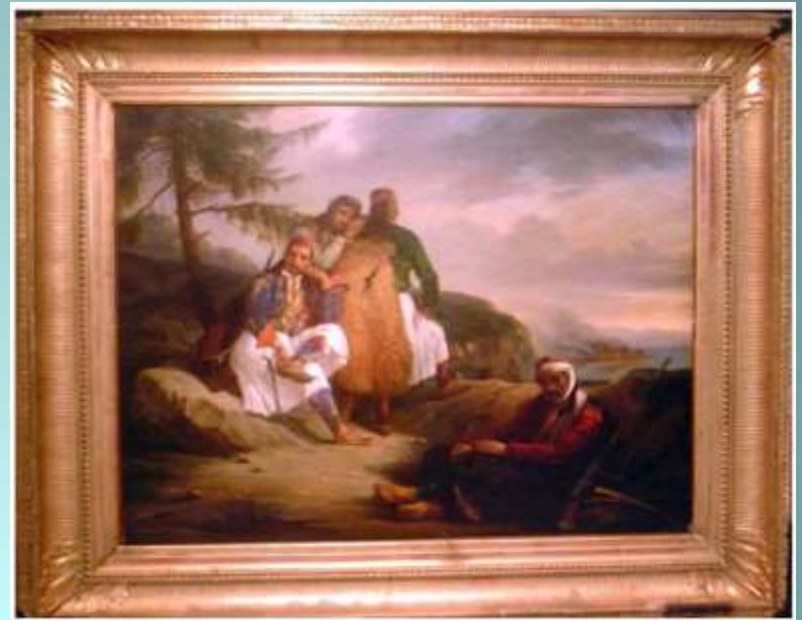
M. Decaisne « Αρματολοί και Κλέφτες », ελαιογραφία σε καμβά, 1826

Εικαστική προσέγγιση της έννοιας της Ελευθερίας με αφετηρία την Ελληνική Επανάσταση του 1821, περιδιάβαση στον κόσμο του Ρομαντισμού και των φιλελλήνων ζωγράφων του 19 ου αιώνα και «απόπλου» σε εικαστικές ανησυχίες-δημιουργίες στο σύγχρονο κόσμο.