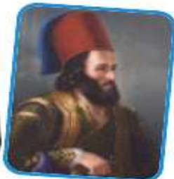
Karl Wieland, «Παπαφλέσας», ελαιογραφία σε καμβά, Αυστριακή Σχολή, 19ος αι.