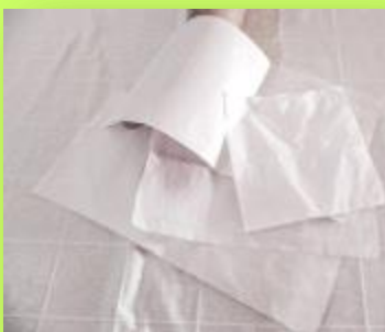
Λεπτά, διαφανή χαρτιά