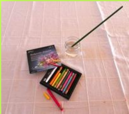
Υδατοδιαλυτά παστέλ Μπουκαλάκι με νερό Πινέλο