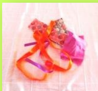
Υφάσματα και κορδέλες