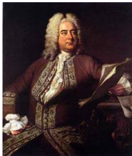
Ο Γκέοργκ Φρίντριχ Χαίντελ