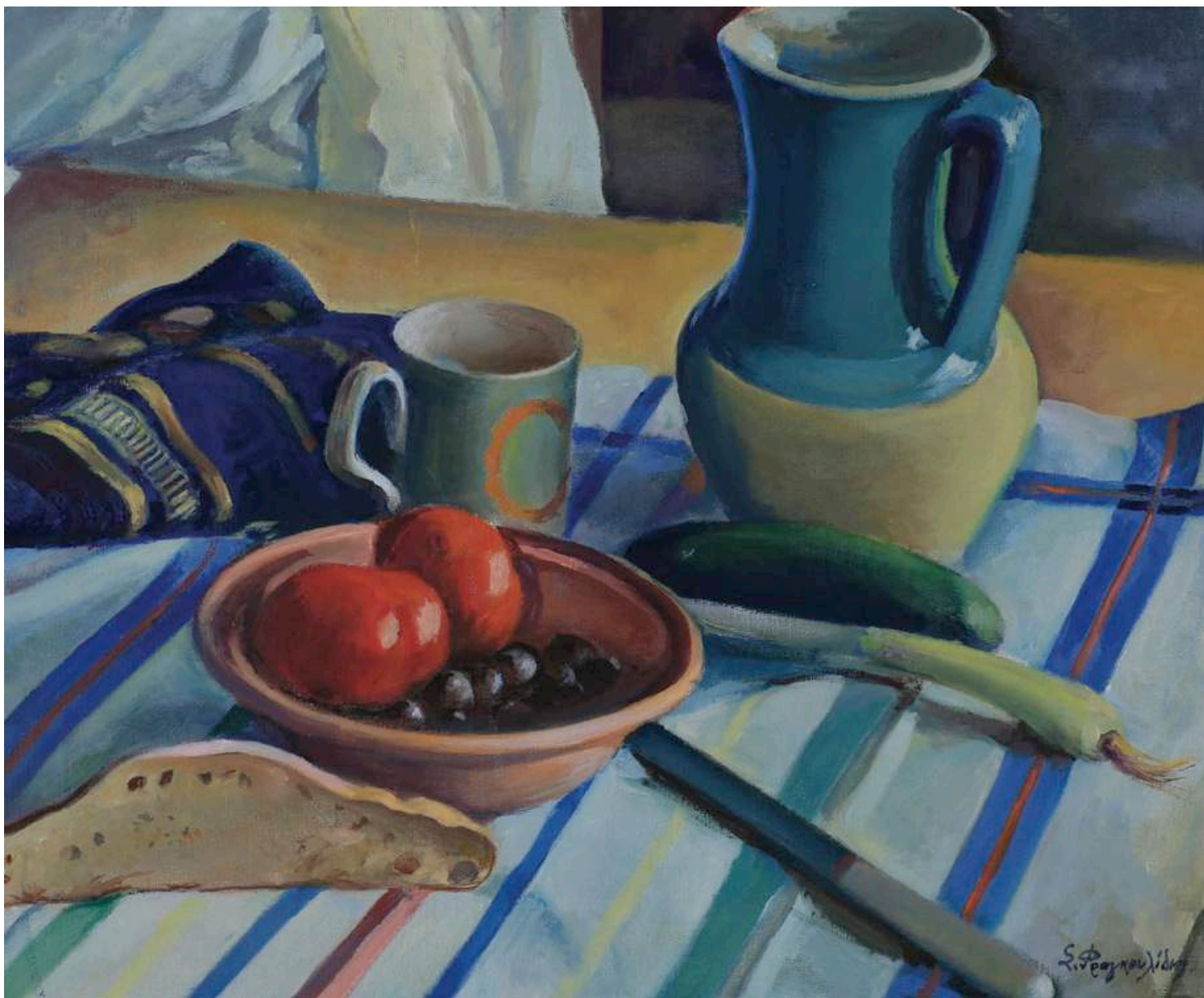
Σολωμός Φραγκουλίδης “ Το τραπέζι του φτωχού ”, Λάδι, αρχές 20ου αι.