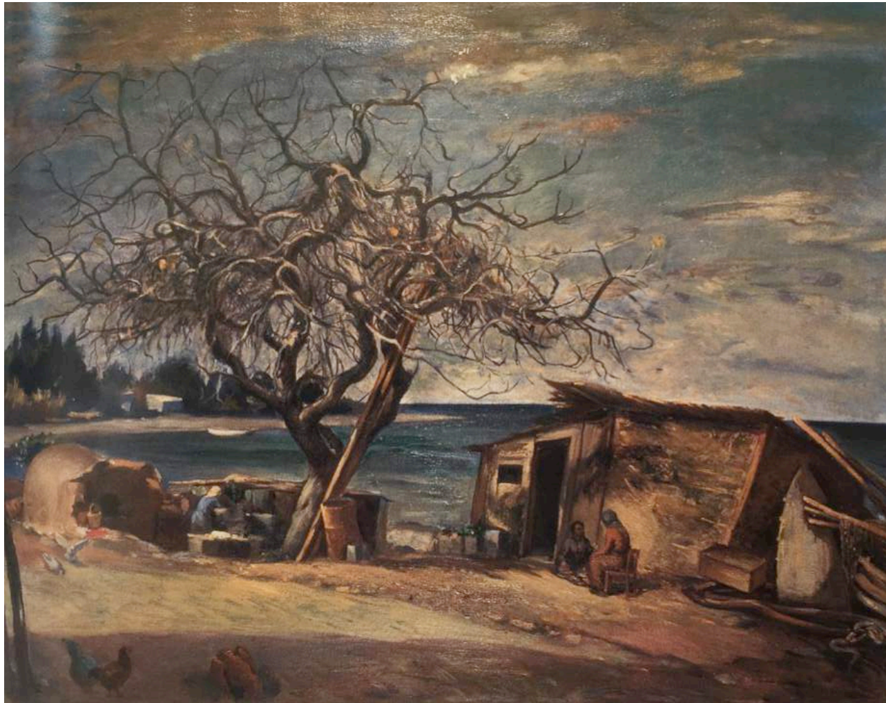
Σολωμός Φραγκουλίδης, «Το σπίτι του ψαρά» λάδι, 1963. Συλλογή Τράπεζας Κύπρου