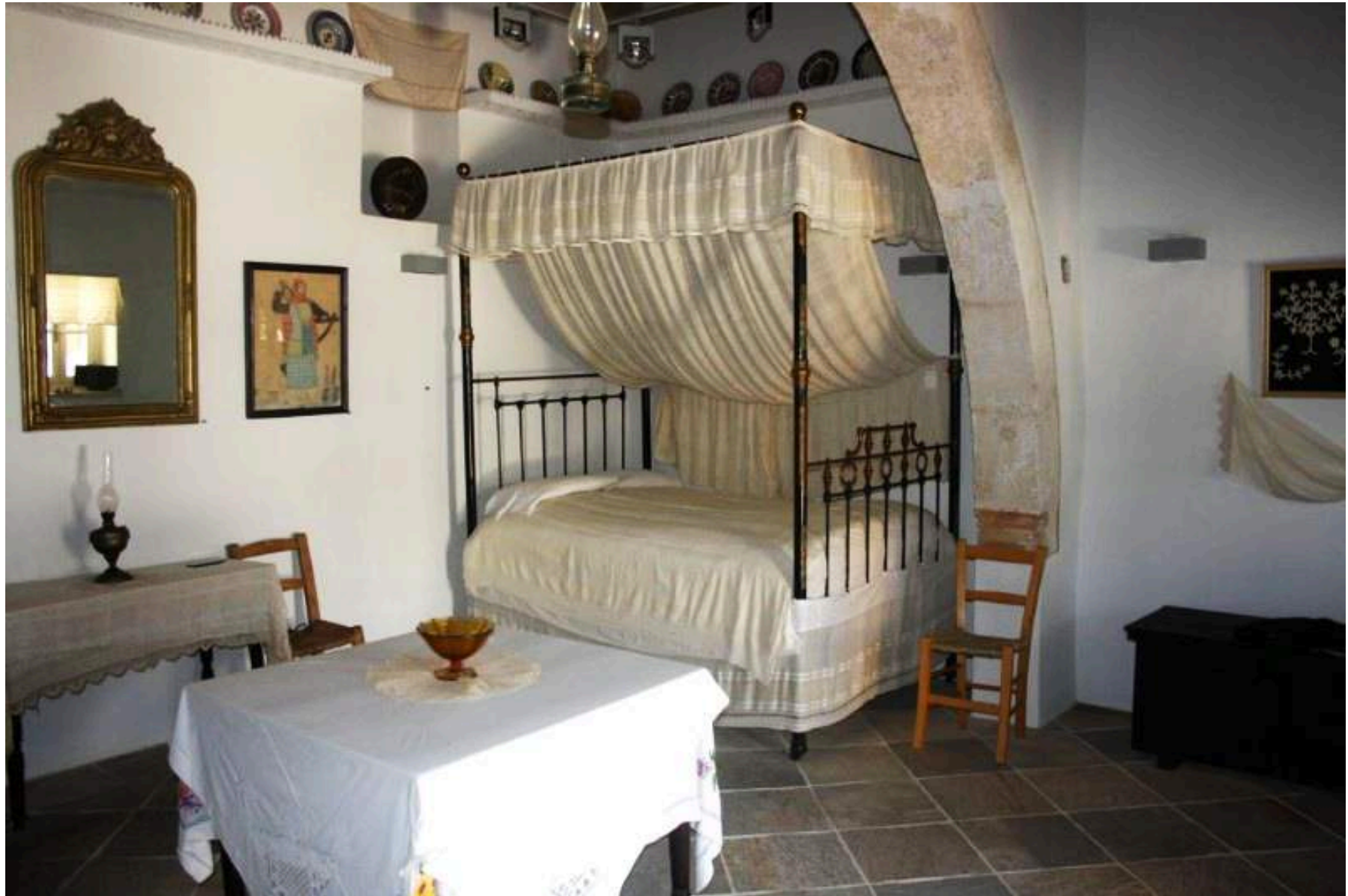
Παραδοσιακό σπίτι που ανήκει στον Δήμο Παραλιμνίου και λειτουργεί ως εκθεσιακός χώρος παραδοσιακών αντικειμένων. Όλο το υλικό αποτελεί δωρεά δημοτών του Δήμου Παραλιμνίου