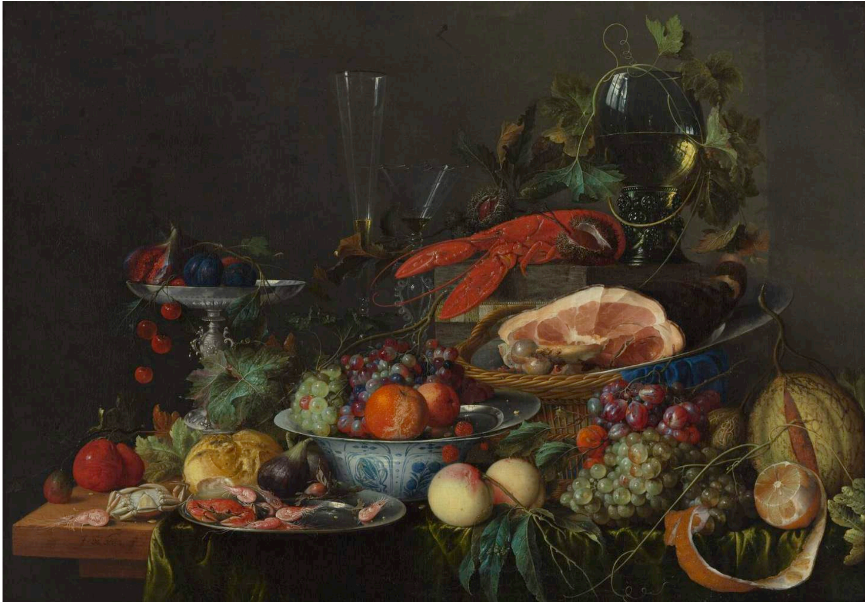
Jan Davidsz. de Heem "Still Life with Ham, Lobster and Fruit" , 1652