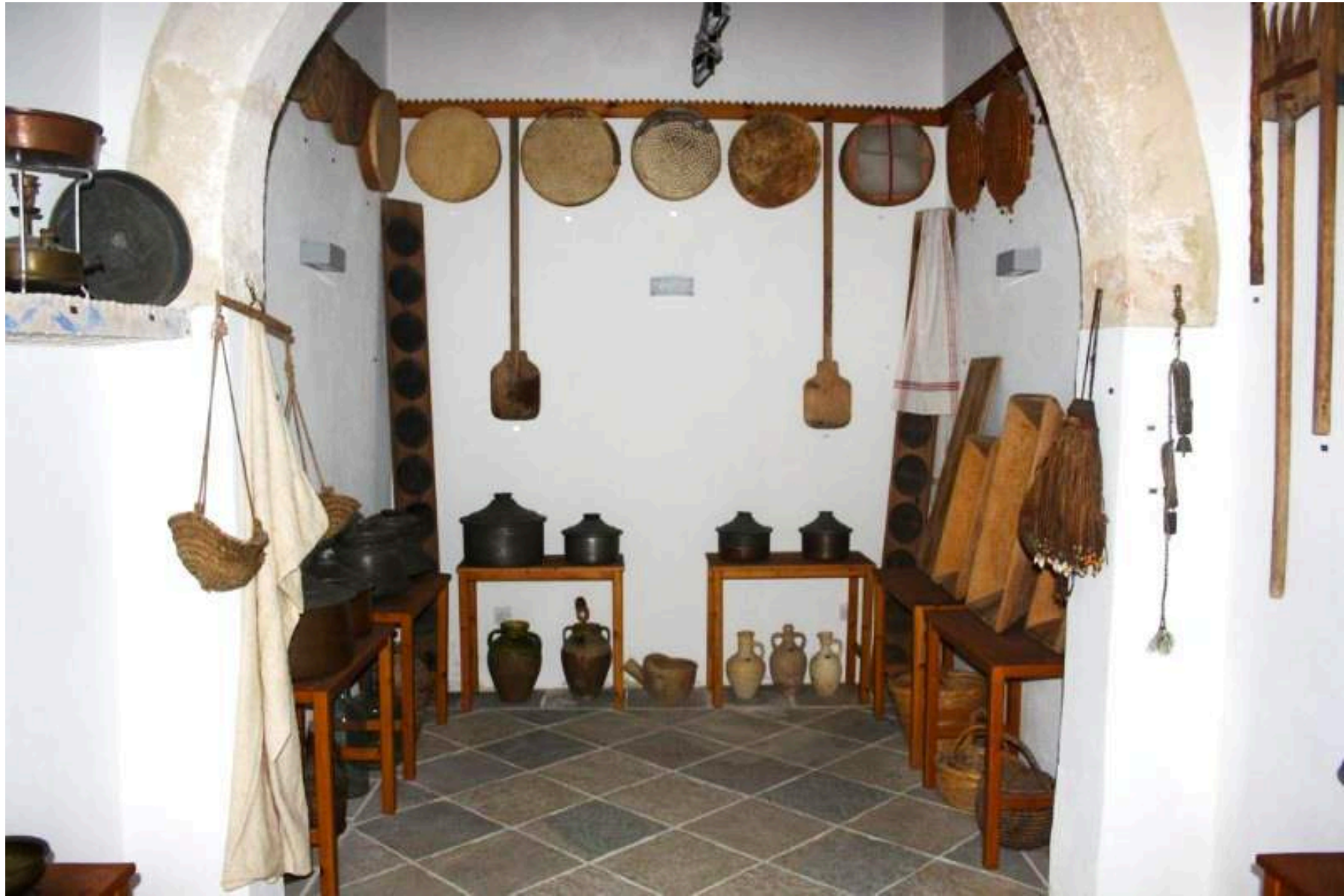
Παραδοσιακό σπίτι που ανήκει στον Δήμο Παραλιμνίου και λειτουργεί ως εκθεσιακός χώρος παραδοσιακών αντικειμένων. Όλο το υλικό αποτελεί δωρεά δημοτών του Δήμου Παραλιμνίου