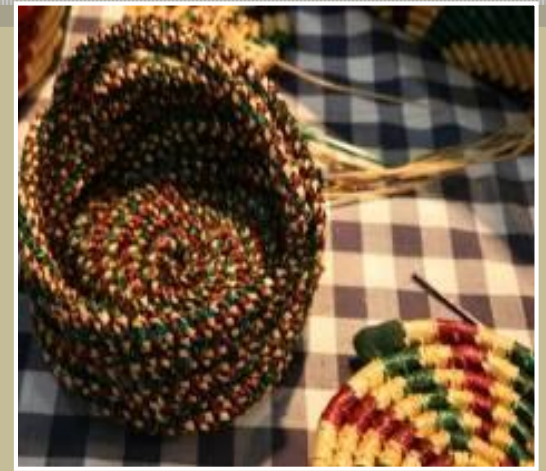
Κυπριακή παραδοσιακή τέχνη