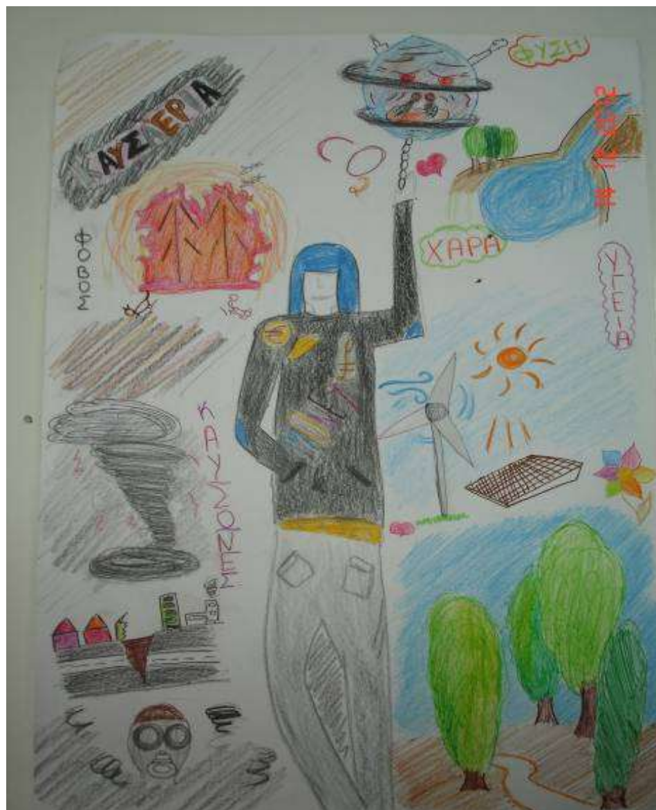
Σωτηρία Φρυδά, Β2

Γυμνάσιο Αρχαγγέλου, 2012-2013 Διδάσκουσα: Γεωργία Τσιάρτα