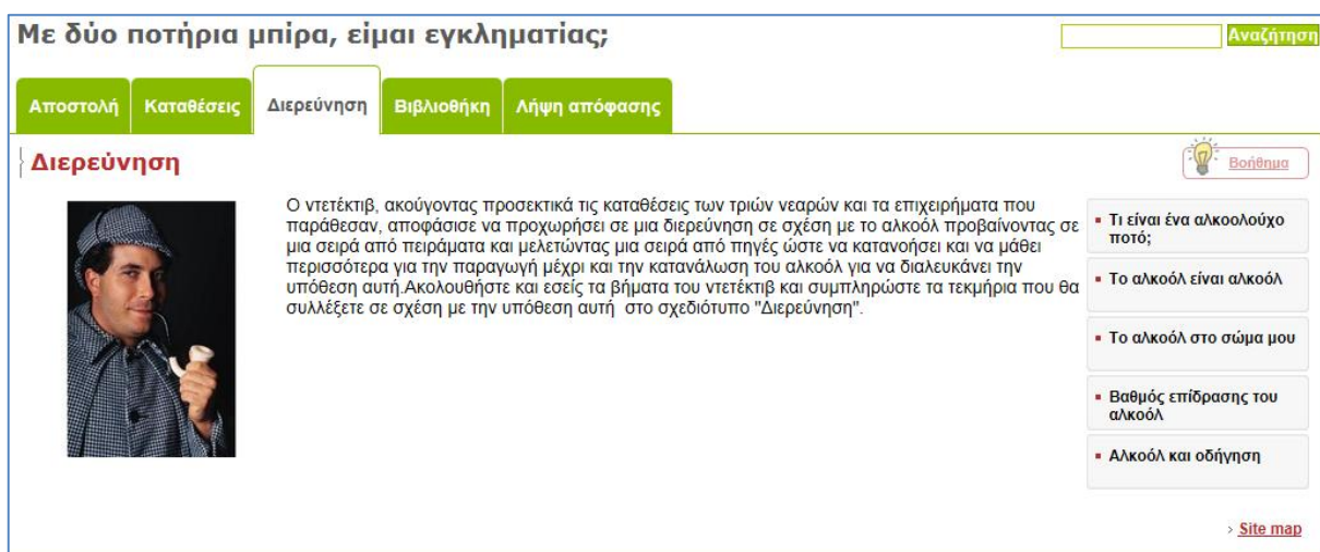
Εικόνα 2: Περιβάλλον διερεύνησης στη διαδικτυακή πλατφόρμα ΣΤΟΧΑΣΜΟΣ

Για να μπορέσουν να λύσουν το πρόβλημα που τους δόθηκε, οι μαθητές διερευνούν την επίδραση του αλκοόλ στον ανθρώπινο οργανισμό, προβαίνοντας σε μια σειρά από πειράματα και μελετώντας δεδομένα, ώστε να μάθουν περισσότερα για διαδικασία παραγωγής του αλκοόλ και την επίδρασή του στον ανθρώπινο οργανισμό. Συγκεκριμένα, στο στάδιο αυτό οι μαθητές συλλέγουν τις πληροφορίες που χρειάζονται μέσα από διάφορες πολυμεσικές πηγές (π.χ. φωτογραφίες, βίντεο, διαγράμματα, άρθρα) μέσα από το διαδικτυακό περιβάλλον διερεύνησης και στη συνέχεια οργανώνουν και ερμηνεύουν τα δεδομένα αυτά στον αναστοχαστικό «Φάκελο εργασίας» στην πλατφόρμα ΣΤΟΧΑΣΜΟΣ.