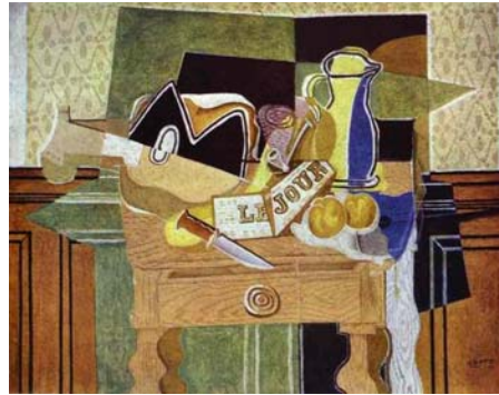
Νεκρή φύση Le jour, Ζωρζ Μπρακ, 1929