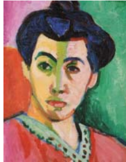
Η κυρία Ματίς, Ανρί Ματίς, 1906