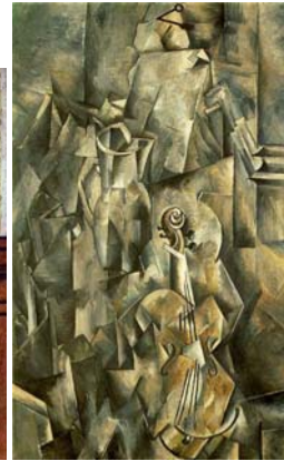
Νεκρή φύση με κανάτα και βιολί, Ζωρζ Μπρακ, 1909