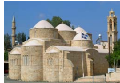
Πεντάτρουλλη Εκκλησία Οσίων Βαρνάβα και Ιλαρίωνα, Περιστερώνα, 12 ος αι.