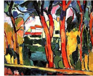
Κόκκινα δέντρα, Μορίς ντε Βλαμίνκ, 1907