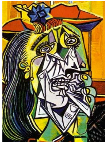
Γυναίκα που κλαίει, Πικάσο, 1937