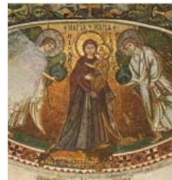
Αγγελόκτιστη, Κίτι, 13 ος αι.