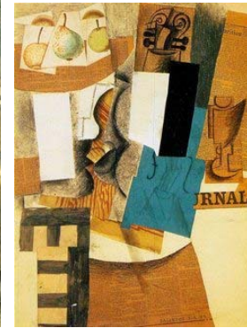
Φρουτιέρα, βιολί και ποτήρι κρασιού, Πικάσο, 1912