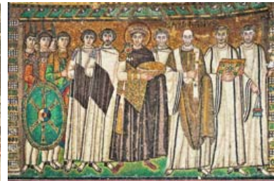
Ιουστινιανός, Ραβέννα, 6 ος αι.