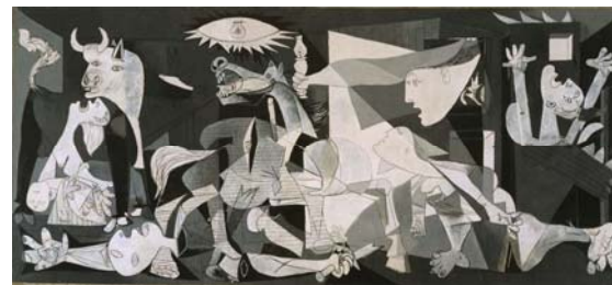
Γκουέρνικα, Πικάσο, 1937