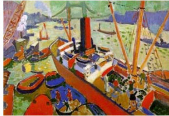
Η Αποβάθρα του Λονδίνου, Αντρέ Ντερέν, 1906