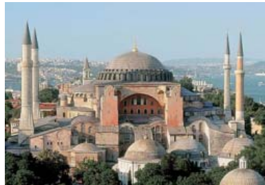
Αγία Σοφία, Κωνσταντινούπολη, 532-537