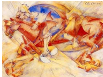
Ο κόκκινος καβαλάρης, Κάρλο Καρρά, 1913