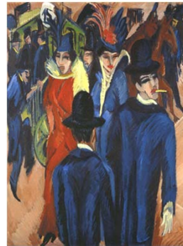
Σκηνή σε δρόμο του Βερολίνου, Ερνστ Λούτβιχ Κίρχνερ, 1913-1914