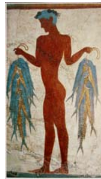
Τοιχογραφίες: Τα δύο παιδιά που μονομαχούν, 1550 π.Χ., Ο ψαράς, 1650 π.Χ.