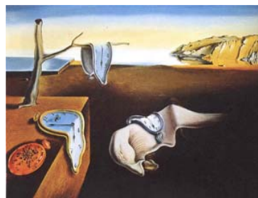
Η Εμμονή της μνήμης, Σαλβαντόρ Νταλί, 1931