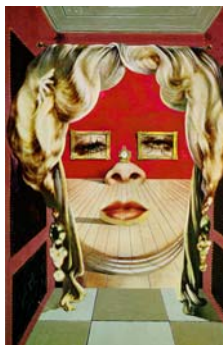
Mae West, Σαλβαντόρ Νταλί, 1935