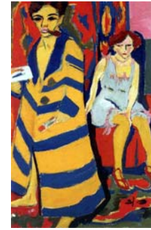
Αυτοπροσωπογραφία με μοντέλο, Ερνστ Λούτβιχ Κίρχνερ, 1910