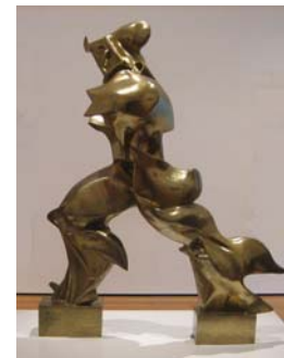
Ενιαίες μορφές στη συνέχεια του χώρου, Ουμπέρτο Μποτσιόνι, 1913