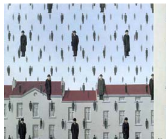
Η Πτώση, Ρενέ Μαγκρίτ, 1953