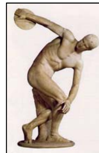
Δισκοβόλος, Μύρωνας 450 π.Χ.