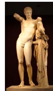
Ερμής, Πραξιτέλης 343 π.Χ.