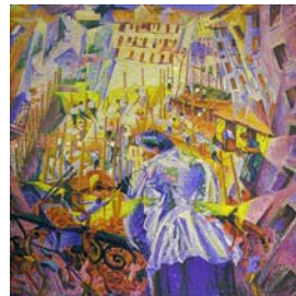
Οι θύρνοι της πόλης εισβάλλουν στο σπίτι, Ουμπέρτο Μποτσιόνι 1911