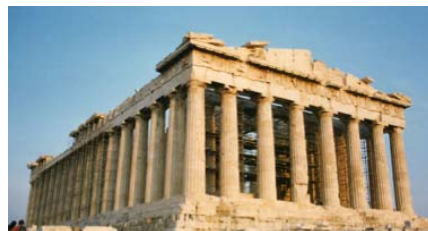
Παρθενώνας, 5 ος αι.