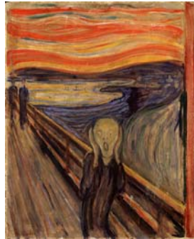
Η κραυγή, Έντβαρντ Μουνκ, 1910