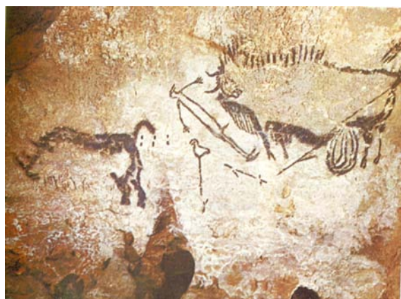
ΒΟΥΒΑΛΙ ΣΠΗΛΑΙΟ ΛΑΣΚΩ 15000 π.Χ