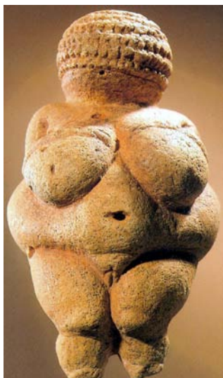
Α.2. Ζ.1.ΑΦΡΟΔΙΤΗ ΤΟΥ ΒΙΛΛΕΝΤΟΡΦ 20000 π.Χ