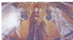
E.26.ΨΗΦΙΔΩΤΟ ΠΑΝΑΓΙΑΣ ΑΓΓΕΛΟΚΤΙΣΤΗΣ ΚΙΤΙ 6 ος αι. π.Χ.