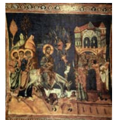
Β.9.ΒΑΙΦΟΡΟΣ ΚΑΛΟΠΑΝΑΓΙΩΤΗΣ 13ος αι.μ.Χ

Οι εικονογραφίες ακολουθούν τα πρότυπα της μεσοβυζαντινής εποχής, ενώ παράλληλα εμπλουτίζονται με θέματα από την παιδική ηλικία και τα πάθη του Χριστού ή της Παναγίας. Συνήθίζεται επίσης η χρήση παραστάσεων της Παλαιάς Διαθήκης που θεωρούνται ότι προεικονίζουν την Καινή Διαθήκη. Στη ζωγραφική εμφανίζονται πιο έντονα φυσιοκρατικά στοιχεία, ενώ αρκετοί καλλιτέχνες επιδιώκουν σταδιακά μία περισσότερο υποκειμενική απόδοση, με αποτέλεσμα να τονίζονται οι εκφράσεις ή οι κινήσεις. Κατά την υστεροβυζαντινή περίοδο η τέχνη της φορητής εικόνας φτάνει στη μεγαλύτερή της ακμή, με πολλές εικόνες να σώζονται μέχρι σήμερα. Η Δυναστεία των Παλαιολόγων που ξεκινά το 1259, αποτελεί ίσως την τελευταία άνθηση της βυζαντινής τέχνης, κυρίως διότι κατά αυτή την περίοδο εντείνεται η αλληλεπίδραση μεταξύ βυζαντινών και Ιταλών καλλιτεχνών.