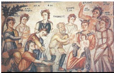
Ε.22.ΨΗΦΙΔΩΤΑ ΠΑΦΟΥ 4ος αι.

Στη Κύπρο σώζονται τα Ψηφιδωτά της Παναγίας της Κανακαριάς (Αμμόχωστο) και της Αγγελόκτιστης (Κίτι) με τα απλά ενδύματα & τις μεγάλες ψηφίδες