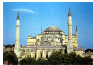
B.2.E.24.ΑΓΙΑ ΣΟΦΙΑ 532-537 μ.Χ

θεματολογία της διακόσμησης περιλαμβάνει θρησκευτικά σύμβολα και θέματα από την Αγία Γραφή, ενώ σπανιότερα απεικονίζονται μυθολογικά αλληγορικά θέματα. Το ψηφιδωτό με την απλοποίηση του σχεδίου ανταποκρίνεται στην υπερβατικότητα της Βυζαντινής τέχνης δηλαδή το ξεπέραςμα του αισθητού κόσμου και την ανύψωση προς το Θείο.