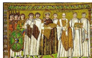
B.4.E.27.ΑΥΤΟΚΡ. ΙΟΥΣΤΙΝΙΑΝΟΣ ΡΑΒΕΝΝΑ 547 μ.Χ