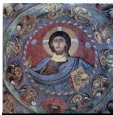
Β.7.ΠΑΝΤΟΚΡΑΤΩΡ ΑΡΑΚΑΣ 1192

Την περίοδο 730-843 η βυζαντινή αυτοκρατορία κλονίζεται από τις έριδες σχετικά με τη λατρεία των θείων μορφών και την απεικόνισή τους στην τέχνη. Στα πλαίσια αυτών, πολλές εικόνες και τοιχογραφίες καταστρέφονται ή αντικαθίστανται από άλλες, με αποκλειστικά διακοσμητικά θέματα, που περιλαμβάνουν την απεικόνιση ζώων, γεωμετρικών μορφών και σταυρών. Μετά την εικονομαχία στην αγιογράφιση των ναών, εφαρμόζεται ένας κοινός κανόνας, αν και όχι πάντα με την ίδια ακρίβεια. Συγκεκριμένα, κάθε μέρος του ναού αποκτά μία συγκεκριμένη συμβολική σημασία και κατά συνέπεια και μία ξεχωριστή θεματολογία στην εικονογράφιση. Κατά αυτό τον τρόπο, στον τρούλο απεικονίζεται ο Θεός που περιβάλλεται από τους Προφήτες ενώ στην αψίδα παριστάνεται η Παναγία είτε κρατώντας το θείο βρέφος είτε μόνη.