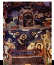
Β.5.Ε.28. ΚΟΙΜΗΣΗ ΘΕΟΤΟΚΟΥ ΑΣΙΝΟΥ 1105 μ.Χ

Την περίοδο της ύφεσης που παρατηρήθηκε στα χρόνια της εικονομαχίας, διαδέχεται η ακμή της βυζαντινής τέχνης στα χρόνια της Μακεδονικής δυναστείας. Σε αυτή την περίοδο, αναπτύσσεται ιδιαίτερα η αρχιτεκτονική, ενώ επικρατεί ο σταυροειδής με τρούλο, χωρίς να απουσιάζει και ο προγενέστερος τύπος της βασιλικής. Οι ναοί διακρίνονται από μεγαλύτερη κομψότητα & είναι λιγότερο λιτοί. Ο πεντάτρουλος ναός (Αγ. Βαρνάβα κ Γλαρίωνα στη Περιστερώνα) είναι ένα μεταβατικός τύπος στη νέα αρχιτεκτονική, τη καμαροσκεπαστη βασιλική με 5