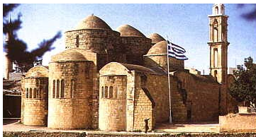
Β.6.ΑΓΙΟΣ ΒΑΡΝΑΒΑΣ-ΓΛΑΡΙΩΝΑΣ ΠΕΡΙΣΤΕΡΩΝΑ 12ος αι. μ.Χ

Στο δεύτερο μισό του 9 ου αιώνα και κατά τη διάρκεια του 10 ου αιώνα, σημαντική άνθηση γνωρίζουν και τα εικονογραφημένα χειρόγραφα, με μικρογραφίες που διακοσμούν τα θρησκευτικά κείμενα.