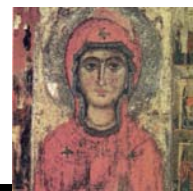
Β.10.ΑΓΙΑ ΜΑΡΙΝΑ ΠΕΔΟΥΛΑΣ 13ος αι. μ.Χ

Η ύστερη βυζαντινή τέχνη οριοθετείται από την κατάληψη της Κωνσταντινούπολης από τους Φράγκους ως την άλωση της. Την περίοδο αυτή, το Βυζάντιο παύει να αποτελεί το ισχυρό πολιτικό και πολιτιστικό κέντρο.