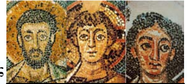
Β.3.Ε.25.ΨΗΦΙΔΩΤΑ ΚΑΝΑΚΑΡΙΑΣ 6ος αι. μ.Χ

σήμερα μεγάλο μέρος δημιουργιών αυτού του είδους.