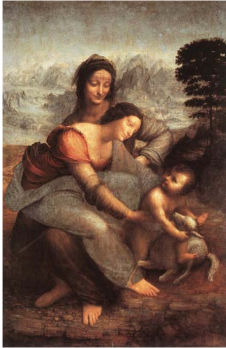
ΛΕΟΝΑΡΝΤΟ ΝΤΑ ΒΙΝΤΣΙ: Η ΠΑΝΑΓΙΑ ΚΑΙ ΒΡΕΦΟΣ ΜΕ ΤΗ ΑΓΙΑ ΑΝΝΑ ΕΛΑΙΟΓΡΑΦΙΑ 1510