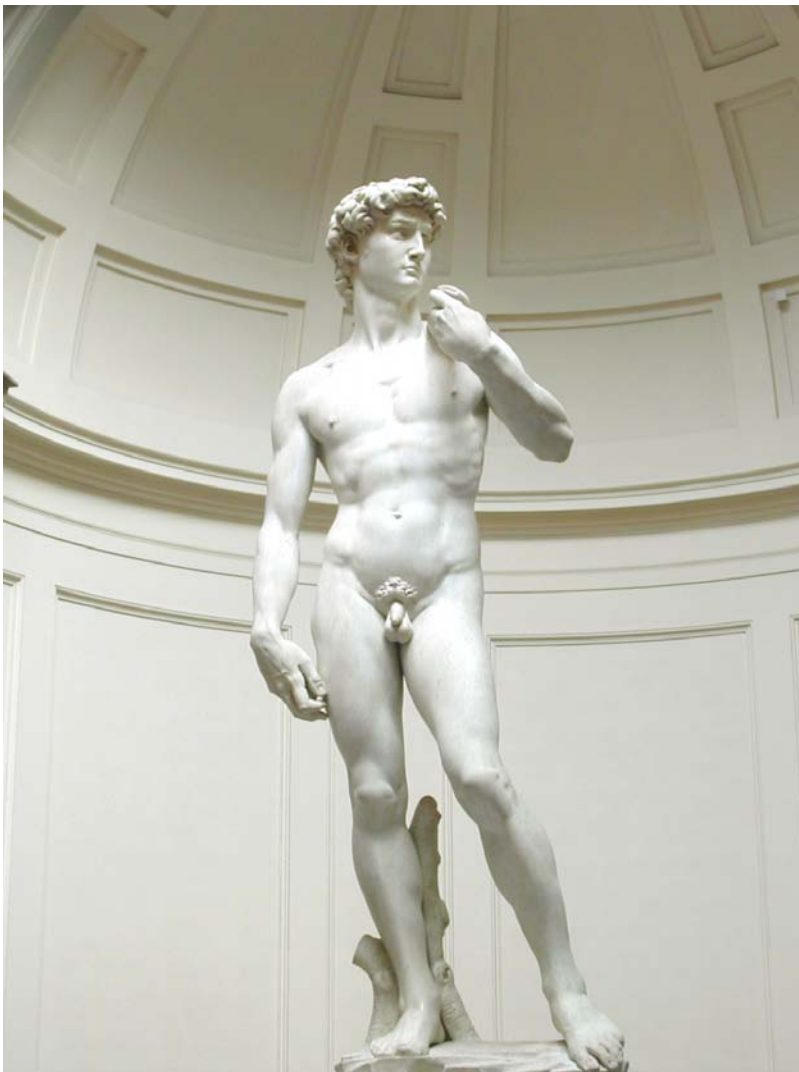
ΜΙΧΑΗΛΑΓΓΕΛΟΣ : ΔΑΒΙΔ, ΜΑΡΜΑΡΟ 1501

Ο Μικελάντζελο ντι Λουντοβίκο Μπουοναρότι Σιμόνι ( Michelangelo di Lodovico Buonarroti Simoni , 6 Μαρτίου 1475 - 18 Φεβρουαρίου 1564 ), γνωστός περισσότερο ως Μιχαήλ Άγγελος , ήταν γλύπτης, ζωγράφος, αρχιτέκτονας και ποιητής της Αναγέννησης. Σήμερα αναγνωρίζεται ως ένας από τους σπουδαιότερους δημιουργούς στην ιστορία της τέχνης.