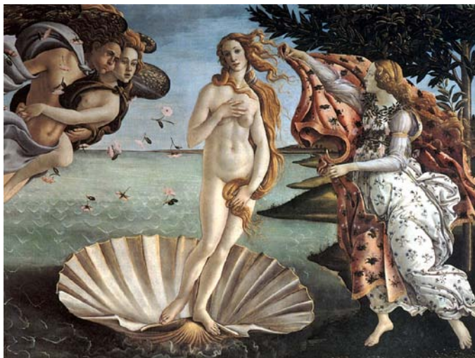
ΜΠΟΤΙΤΣΕΛΙ : ΓΕΝΝΗΣΗ ΤΗΣ ΑΦΡΟΔΙΤΗΣ 1484

ΠΗΓΕΣ: ΙΣΤΟΡΙΑ ΤΗΣ ΤΕΧΝΗΣ Γ' ΤΑΞΗ ΕΝΙΑΙΟΥ ΛΥΚΕΙΟΥ ΣΕΛ. 134 ΠΑΓΚΟΣΜΙΑ ΙΣΤΟΡΙΑ ΤΗΣ ΤΕΧΝΗΣ 3 ος ΤΟΜΟΣ Α' ΓΥΜΝΑΣΙΟΥ ΣΕΛ. 10