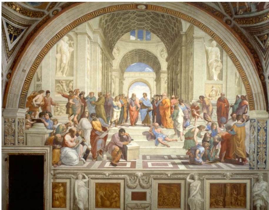
ΡΑΦΑΗΛ : ΣΧΟΛΗ ΑΘΗΝΩΝ , τοιχογραφία, μήκος 7,70 μ., Βατικανό, 1509

Ο Ραφαήλ ή Ραφαέλο Σάντσιο (28 Μαρτίου/6 Απριλίου 1483 - 6 Απριλίου 1520) ήταν Ιταλός ζωγράφος και αρχιτέκτονας της ύστερης Αναγέννησης. Υπήρξε ένας από τους επιφανέστερους καλλιτέχνες της εποχής του, του οποίου η φήμη και η αξία υπήρξαν ανάλογες με εκείνες του Μιχαήλ Αγγελού και του Λεονάρντο ντα Βίντσι. Γεννήθηκε στο Ουρμπίνο και μαθήτευσε αρχικά στο πλευρό του πατέρα του, Τζιοβάνι Σάντι, και αργότερα εκπαιδεύτηκε στο εργαστήριο του Περουτζίνο . Παράλληλα, ήρθε νωρίς σε επαφή με κύκλους μορφωμένων ουμανιστών.