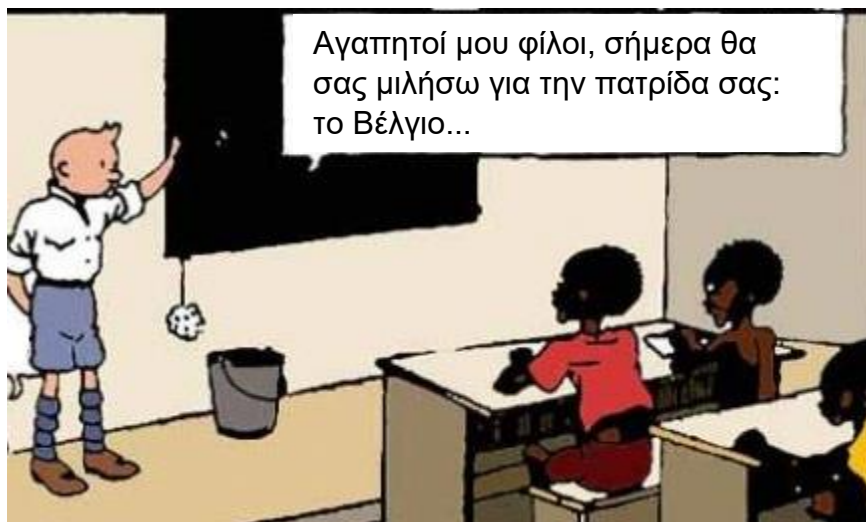
Κωμικογράφημα: Αίθουσα διδασκαλίας κάπου στο Κογκό