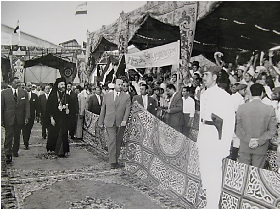
Επίσκεψη του Προέδρου Μακαρίου στην Αίγυπτο το 1961. Τον υποδέχεται ο Πρόεδρος Νάσερ.