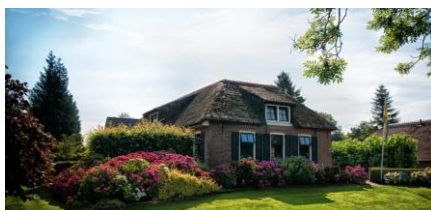
Das Haus in Frankreich