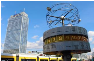
Alexanderplatz im Zentrum von Berlin

Meine Eltern sind geschieden. Mein Vater und meine anderen Geschwister leben nicht mit uns zusammen. Wir wohnen im Zentrum von Berlin, auf dem Alexanderplatz in der Nähe vom Fernsehturm. Ich brauche nur fünf Minuten zu Fuß bis zum Bahnhof. Das ist ganz praktisch. Da fahren viele Züge, S- Bahnen, U- Bahnen und Busse. Am Alexanderplatz können wir sehr gut einkaufen, ins Kino gehen und bummeln.