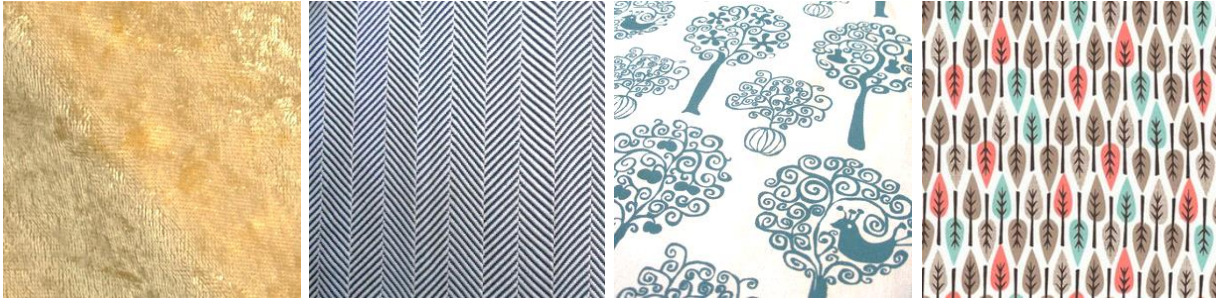
Εικόνα 8: Μεταξωτό Βελούδο

Να προσδιορίσετε και να καταγράψετε την κατηγορία «κατεύθυνσης» στην οποία ανήκουν τα υφάσματα που απεικονίζονται στις Εικόνες 8,9,10 και 11 , με βάση τον τύπο τους και τα χαρακτηριστικά τους. (μονάδες 2)