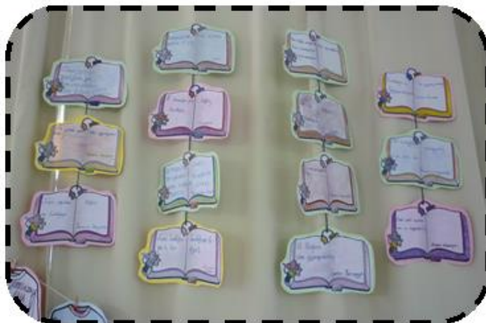
Τα ερωτήματα των παιδιών για την ενότητα