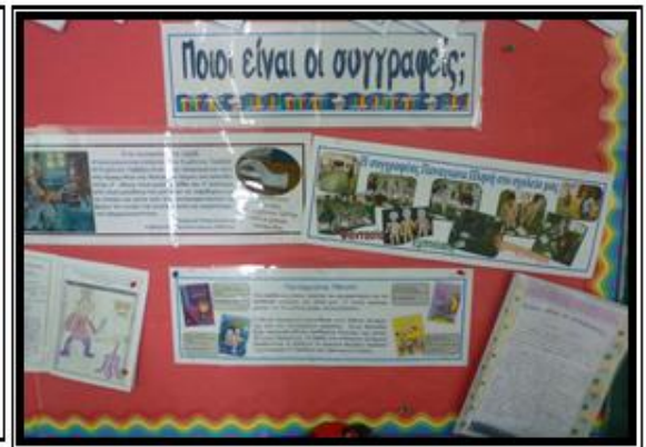
«Η Γραμμή της Ενότητας»