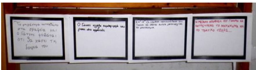
(«Χρονική Γραμμή της Λογοτεχνικής Αφήγησης» - «Story Line»)