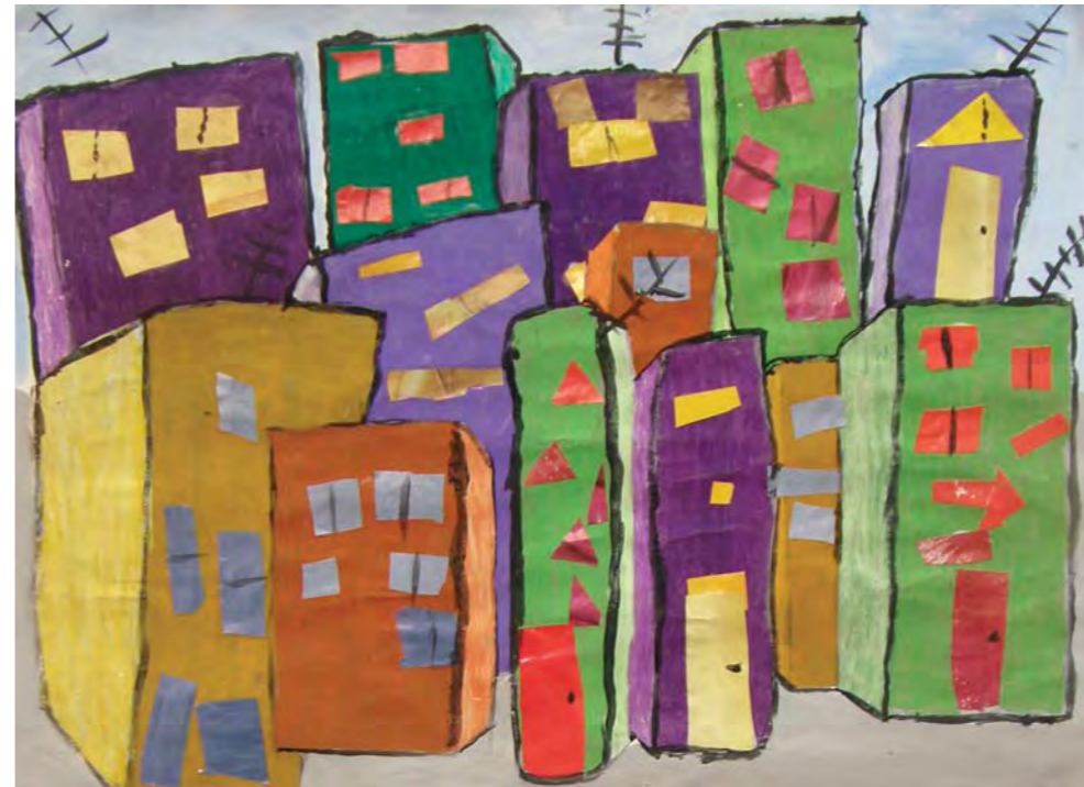
ΟΜΑΔΙΚΗ ΕΡΓΑΣΙΑ (ετών 10) Δημοτικό Πολεμιδιών, Καρμιώτισσας Λεμεσού 2008-2009 «Η πόλη μας»