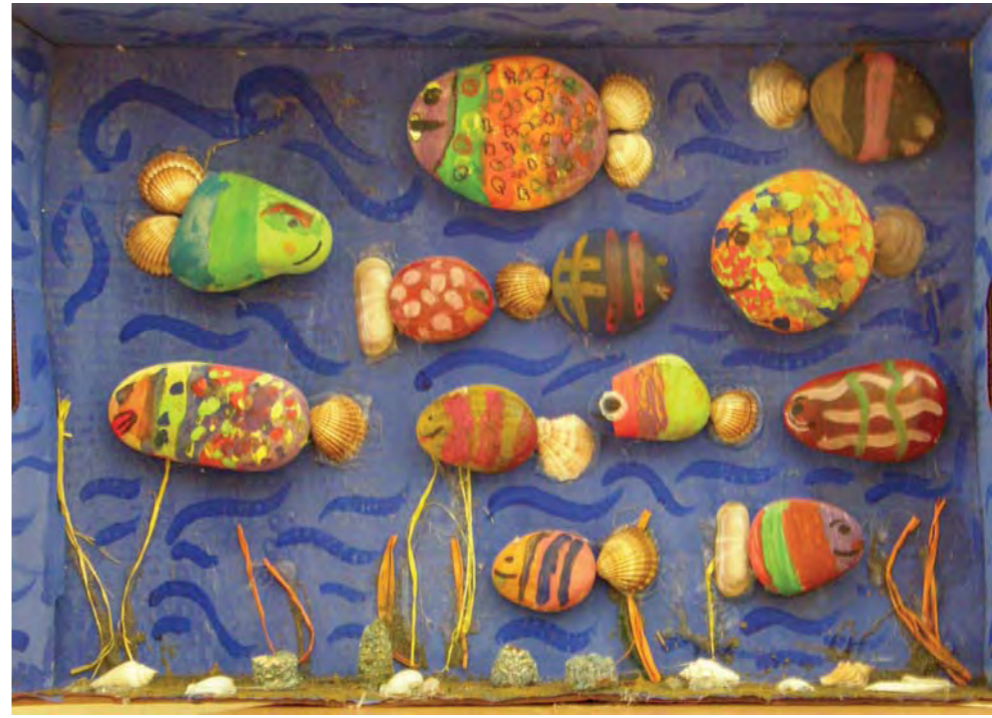
ΟΜΑΔΙΚΗ ΕΡΓΑΣΙΑ (ετών 11) ΚΑ' Δημοτικό Σχολείο Λεμεσού 2008-2009 «Ο βυθός»