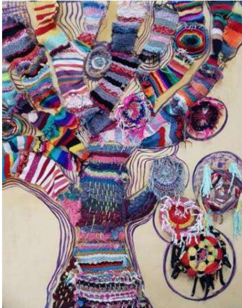
Το δέντρο της Αγάπης