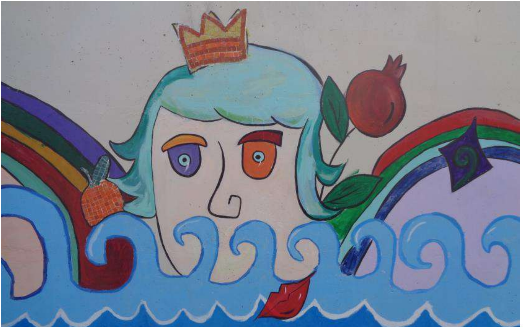
Εικόνες από την τοιχογραφία (7)