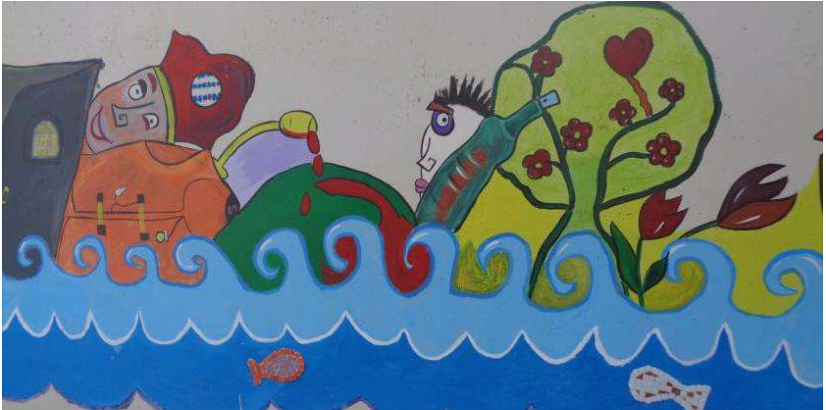
Εικόνες από την τοιχογραφία (3)