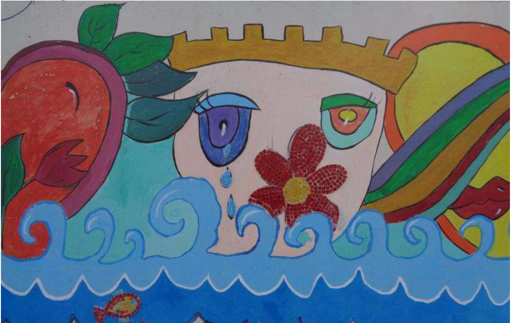
Εικόνες από την τοιχογραφία (5)