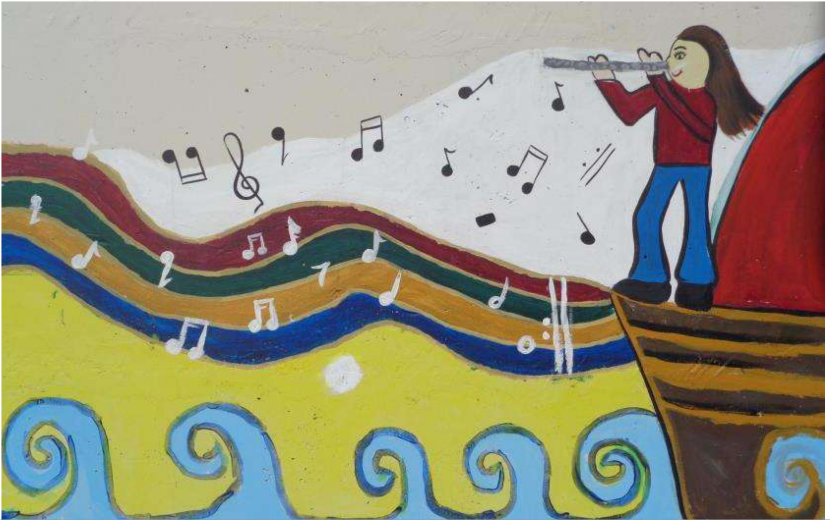
Εικόνες από την τοιχογραφία (2)