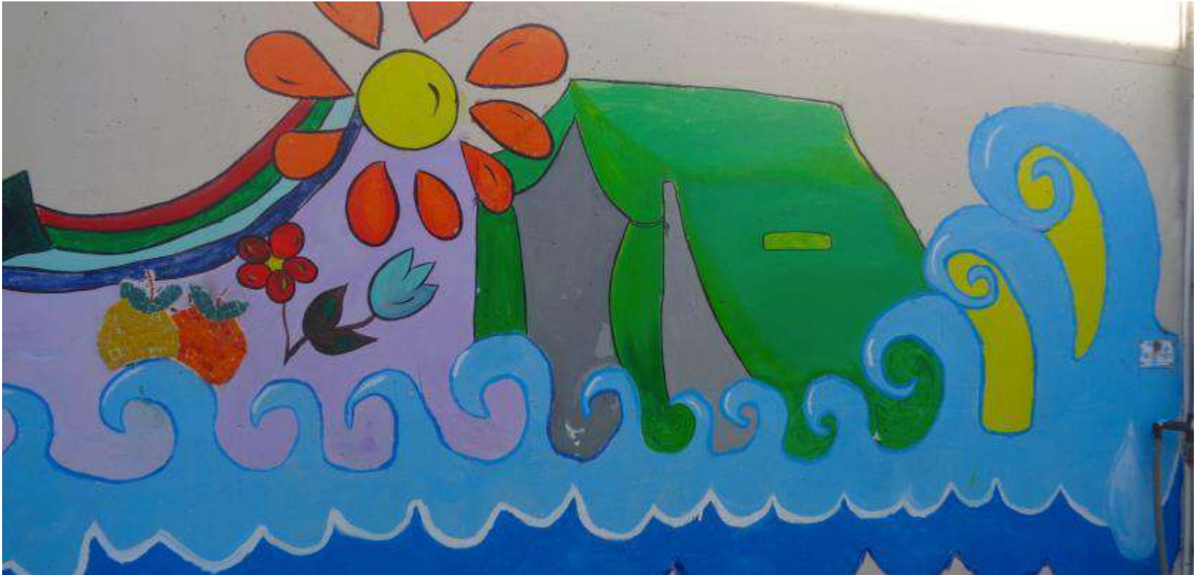
Εικόνες από την τοιχογραφία (8)