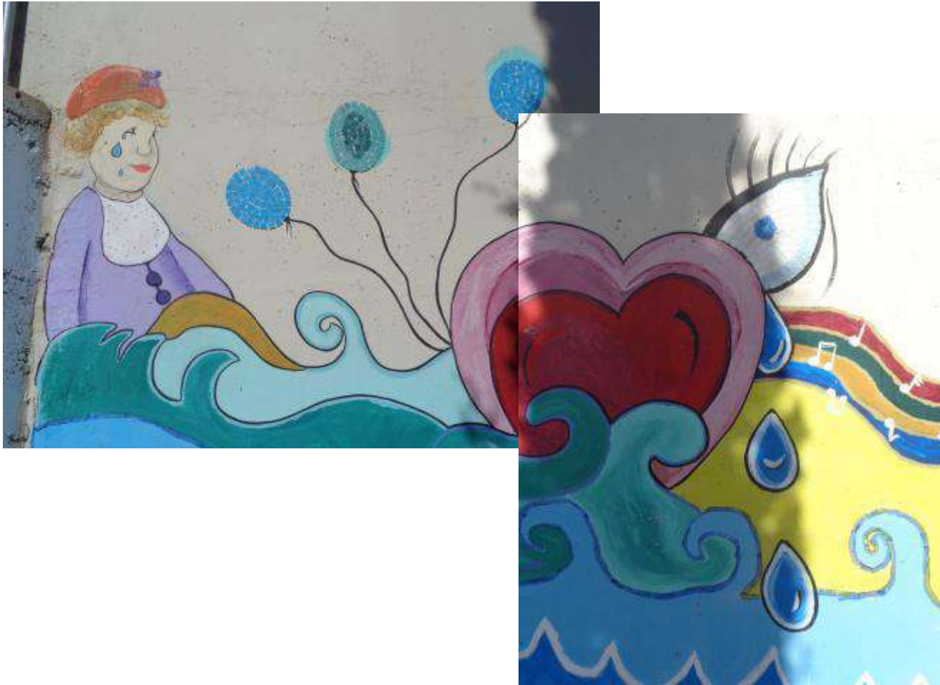
Εικόνες από την τοιχογραφία (1)