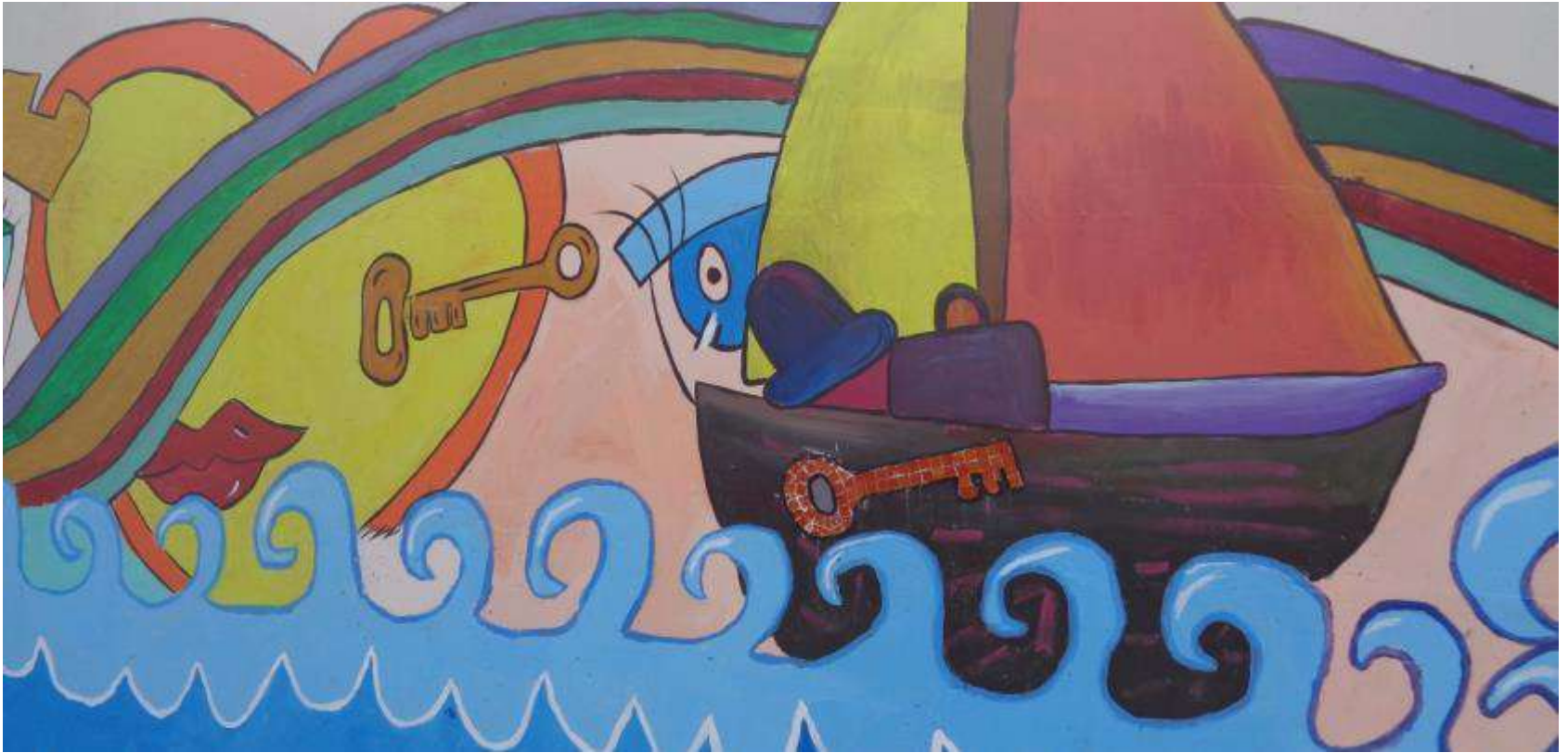
Εικόνες από την τοιχογραφία (6)