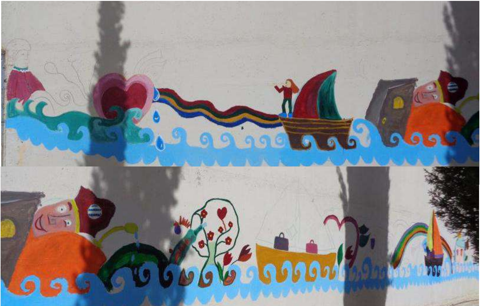
Τοιχογραφία: Στάδιο 1