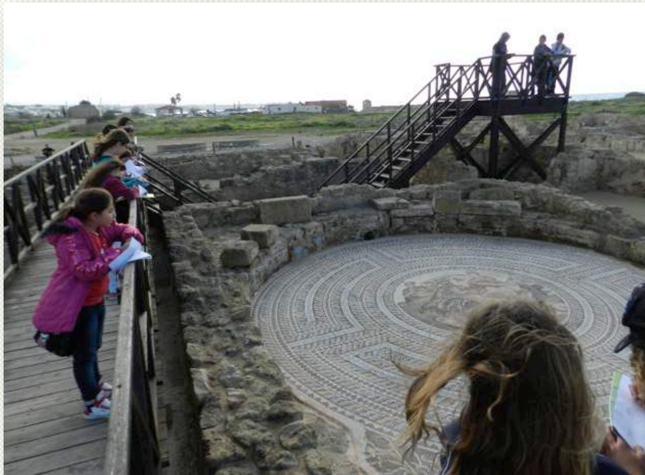
ΤΟ ΨΗΦΙΔΩΤΟ ΤΗΣ ΖΩΗΣ – ΙΓ΄ ΔΗΜΟΤΙΚΟ ΣΧΟΛΕΙΟ ΠΑΦΟΥ 2012 - 2013 THE MOSAIC OF LIFE – 13 TH PUBLIC ELEMENTARY SCHOOL OF PAFOS