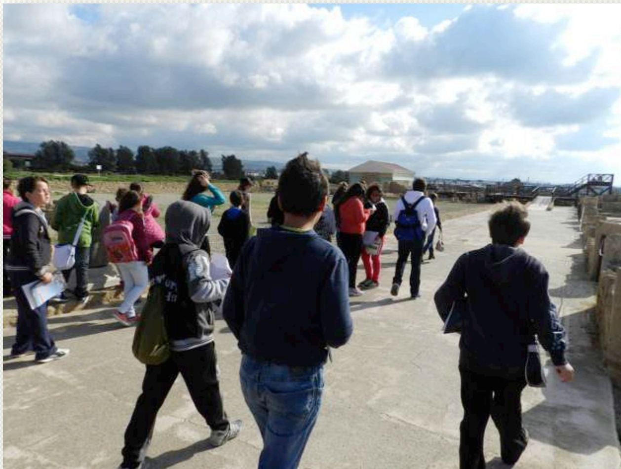
ΤΟ ΨΗΦΙΔΩΤΟ ΤΗΣ ΖΩΗΣ – ΙΓ΄ ΔΗΜΟΤΙΚΟ ΣΧΟΛΕΙΟ ΠΑΦΟΥ 2012 - 2013 THE MOSAIC OF LIFE – 13 TH PUBLIC ELEMENTARY SCHOOL OF PAFOS