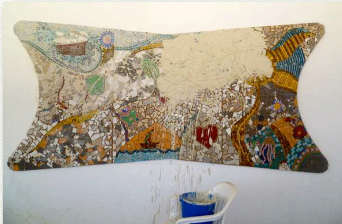
ΤΟ ΨΗΦΙΔΩΤΟ ΤΗΣ ΖΩΗΣ – ΙΓ΄ ΔΗΜΟΤΙΚΟ ΣΧΟΛΕΙΟ ΠΑΦΟΥ 2012 - 2013 THE MOSAIC OF LIFE – 13 TH PUBLIC ELEMENTARY SCHOOL OF PAFOS

When the gluing procedure was completed, the mosaic displayed on the wall and the gaps were filled.