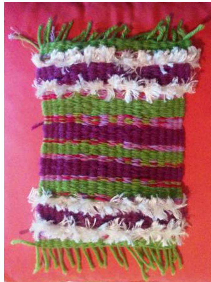
Βιωματικό Εργαστήρι «Ξύλινος αργαλειός»