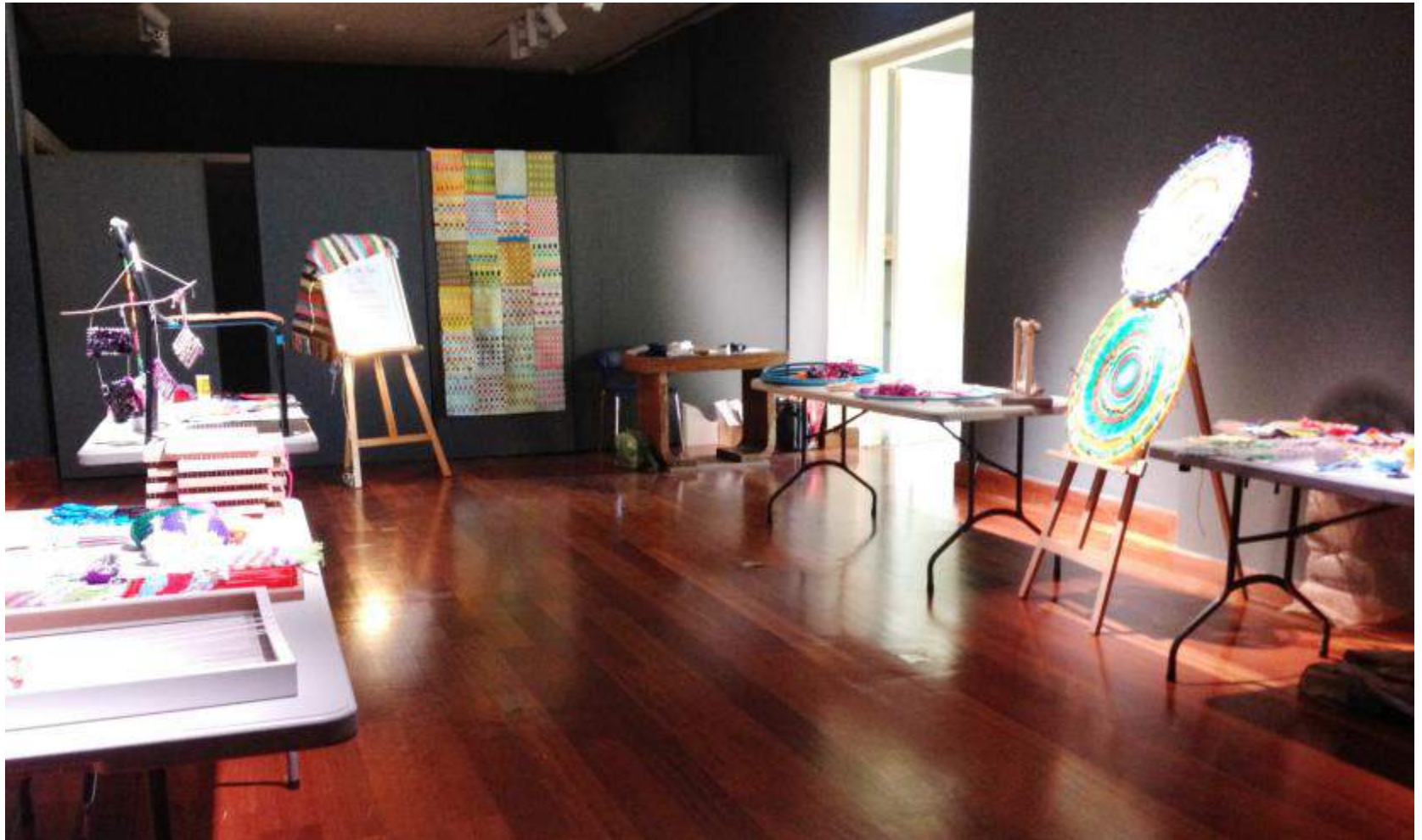
Βιωματικά Εργαστήρια «Τεχνικές ύφανσης για παιδιά».