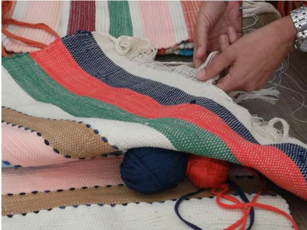
Το τέλειωμα του υφαντού