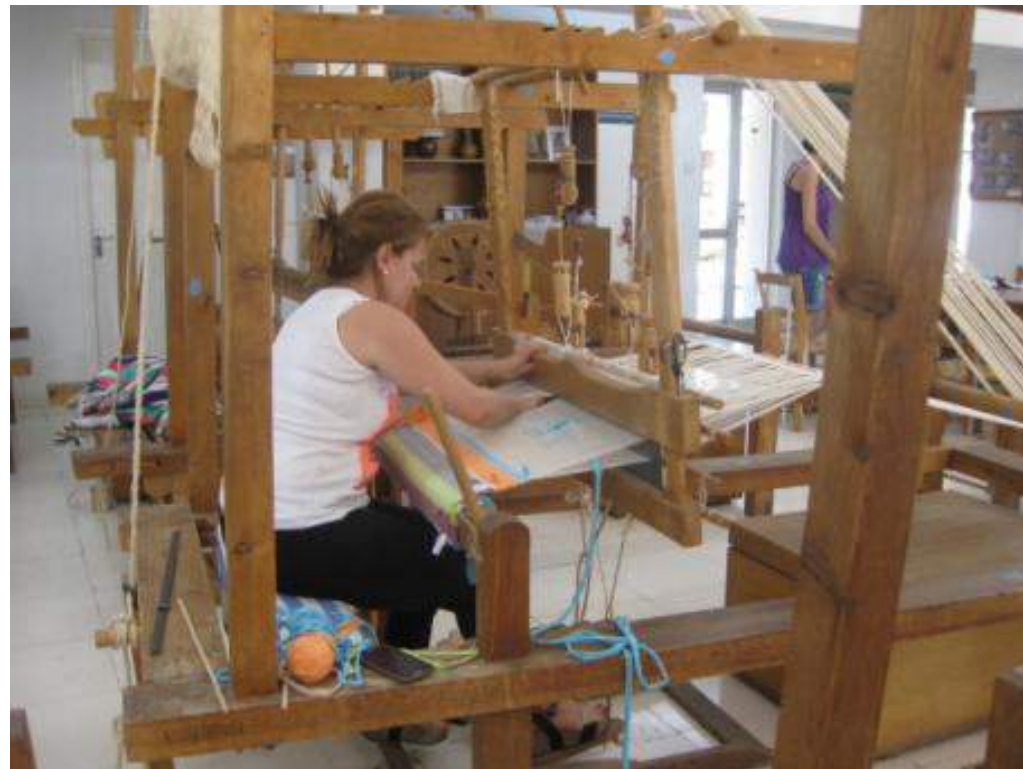
Ύφανση στους αργαλειούς της Υπηρεσίας Κυπριακής Χειροτεχνίας