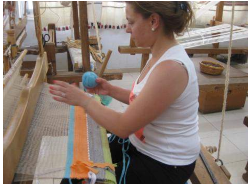
Ύφανση στους αργαλειούς της Υπηρεσίας Κυπριακής Χειροτεχνίας