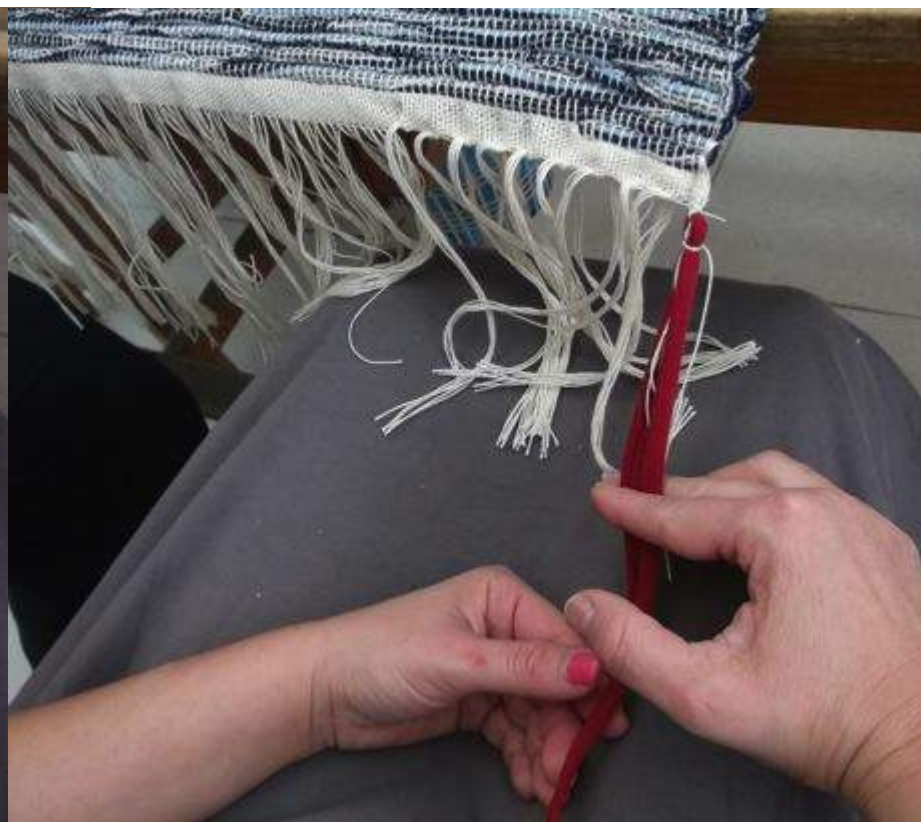
Το τέλειωμα του υφαντού