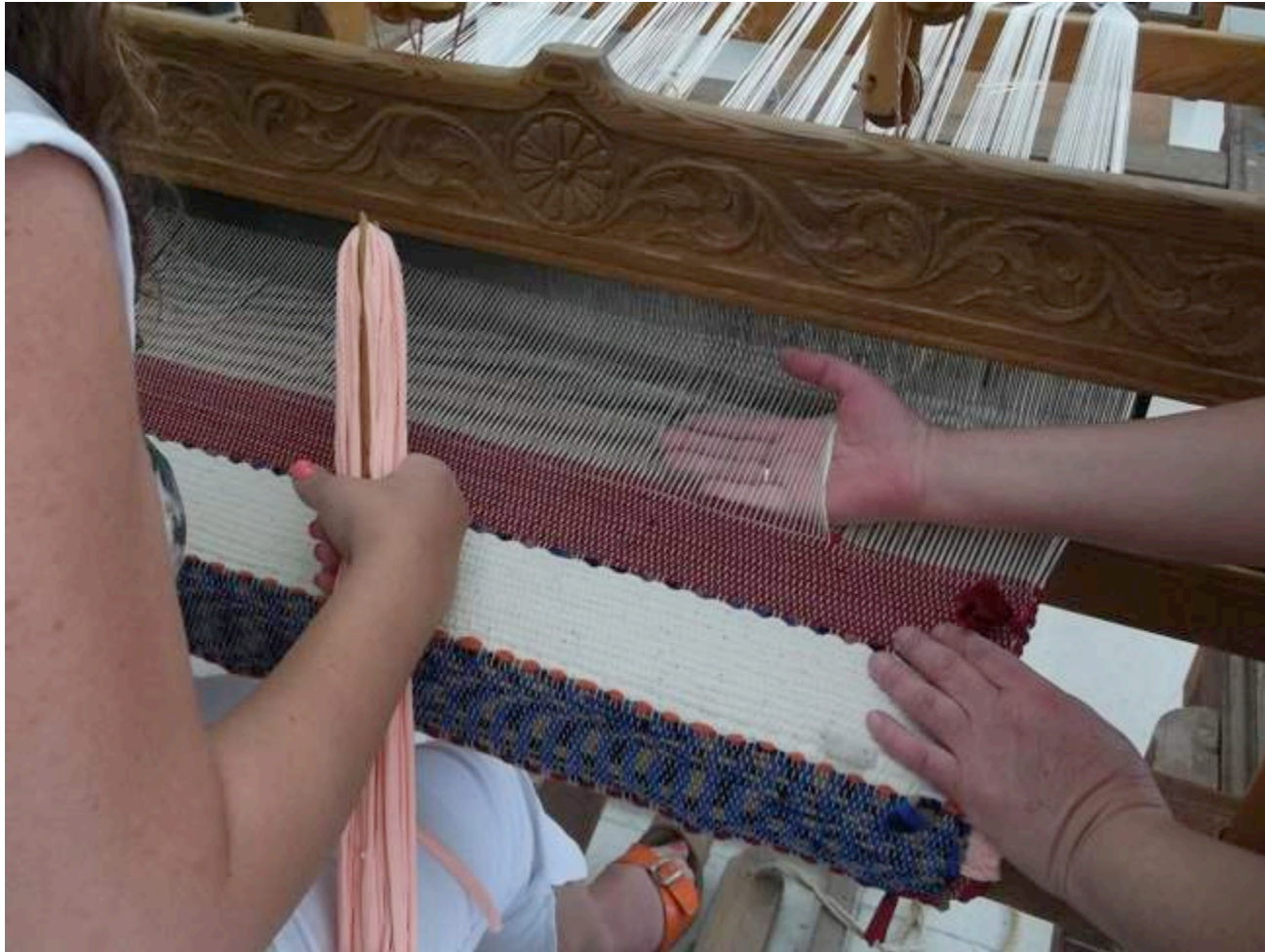
Ύφανση στους αργαλειούς της Υπηρεσίας Κυπριακής Χειροτεχνίας.