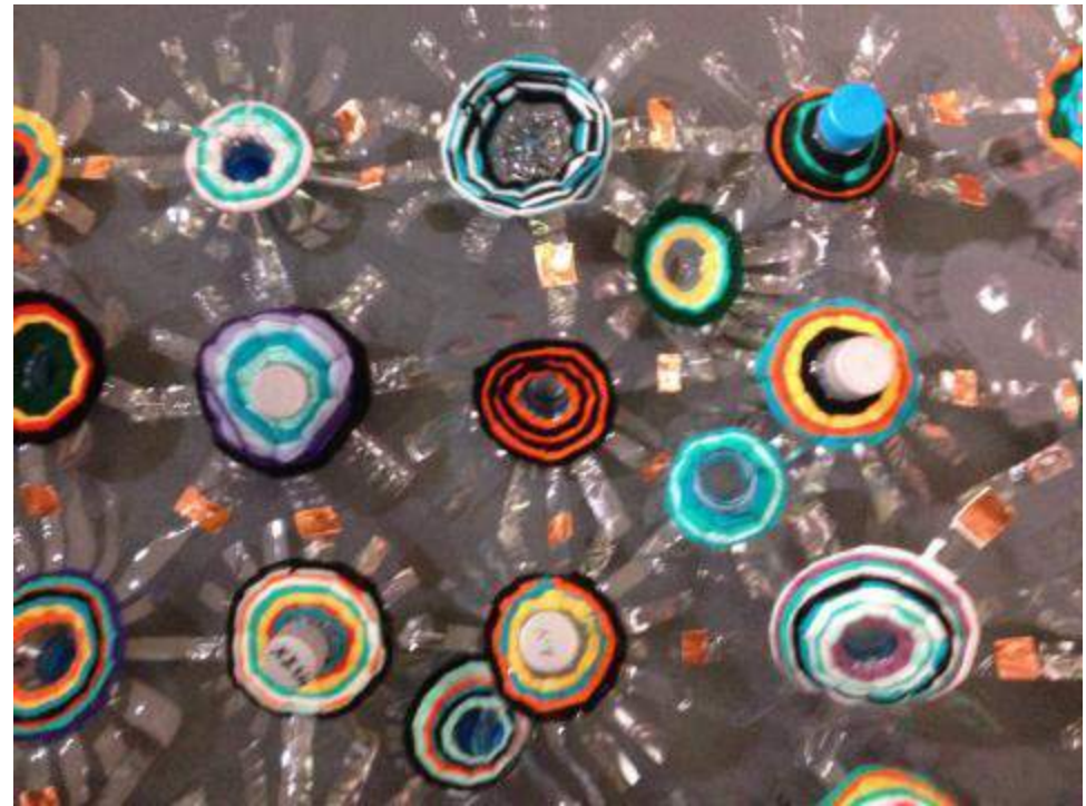
Βιωματικό Εργαστήρι «Κυκλική Ύφανση»