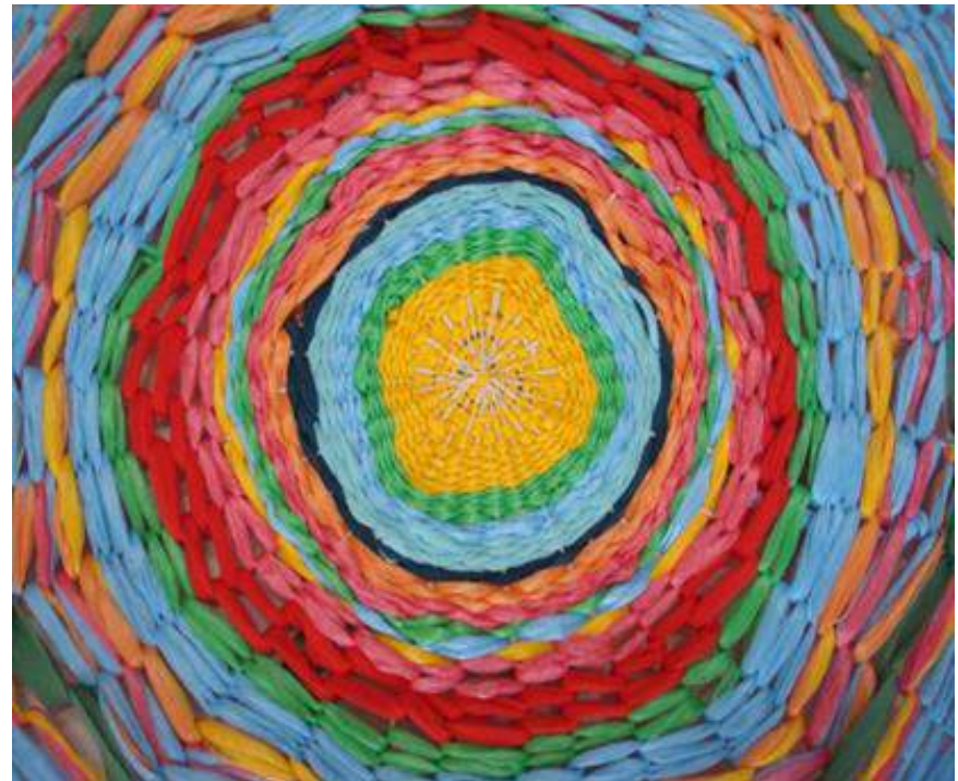
Βιωματικό Εργαστήρι «Υφανση σε στρογγυλό αργαλειό»