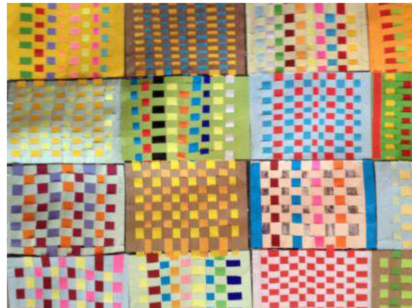
Βιωματικό Εργαστήρι «Υφανση λωρίδων χαρτιού πάνω σε χαρτονάκι»