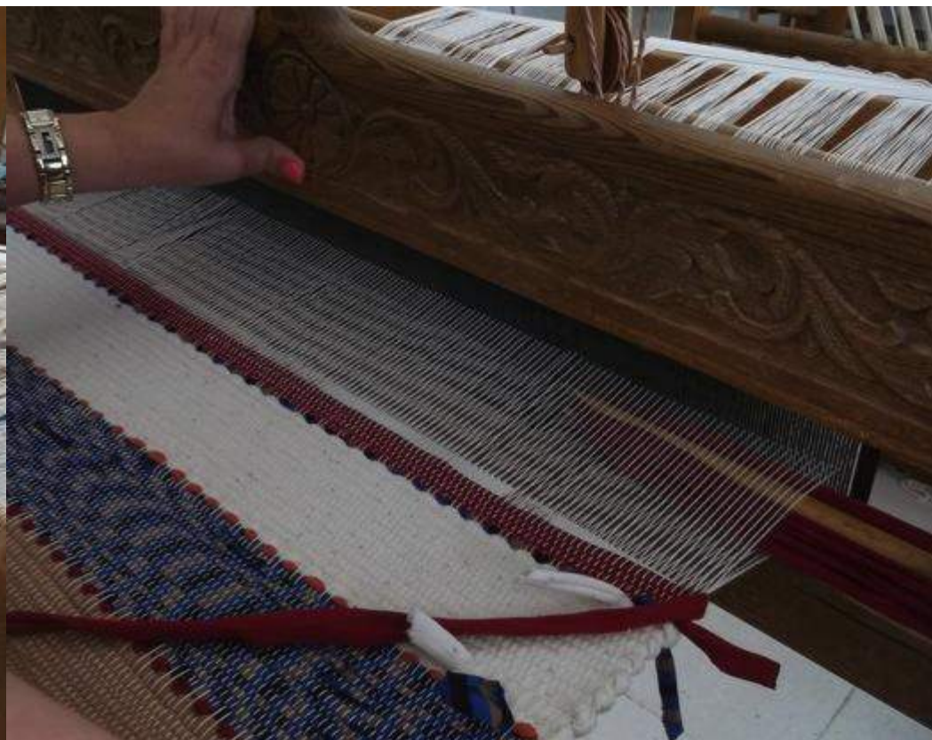
Ύφανση στους αργαλειούς της Υπηρεσίας Κυπριακής Χειροτεχνίας.