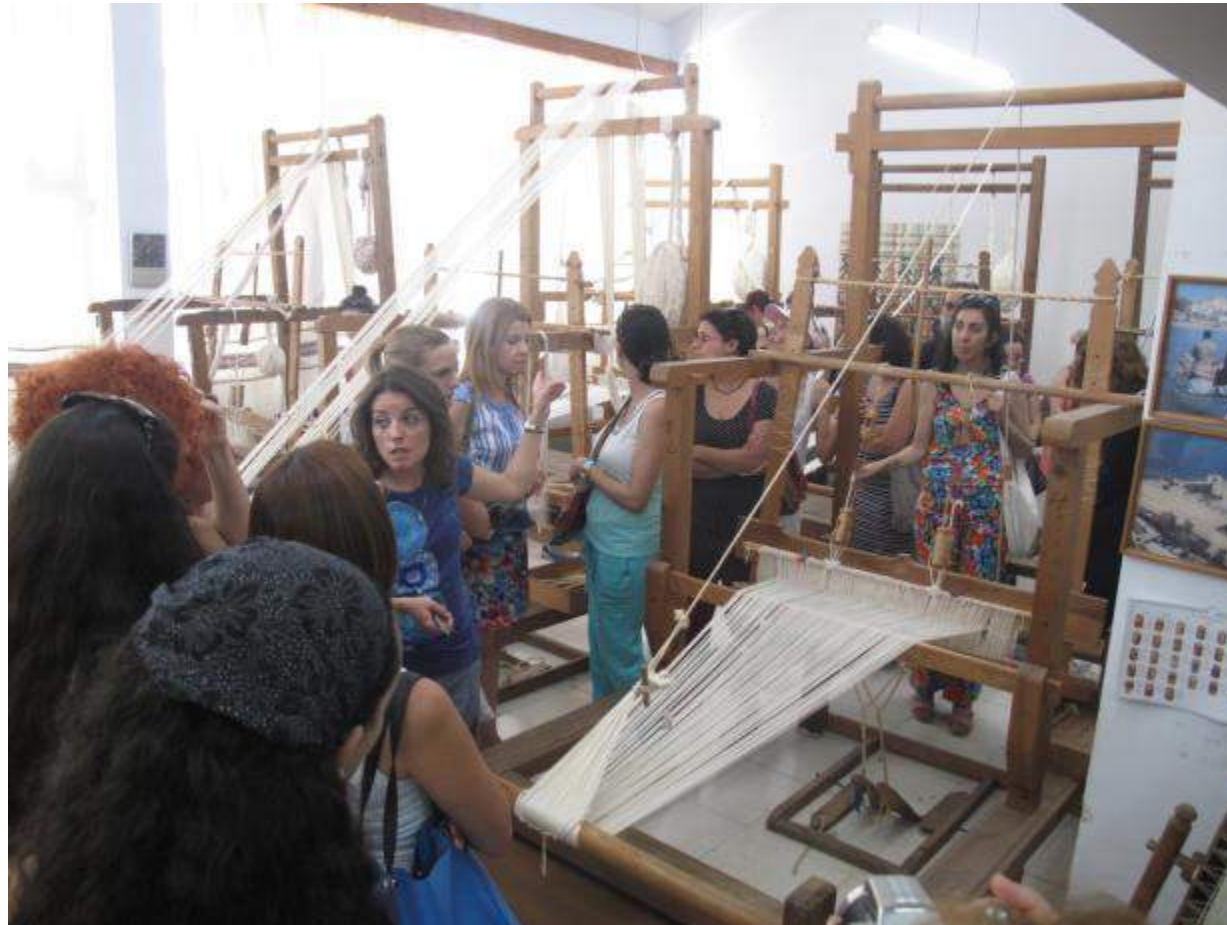
Επίσκεψη στο εργαστήριο ύφανσης της Υπηρεσίας Κυπριακής Χειροτεχνίας.