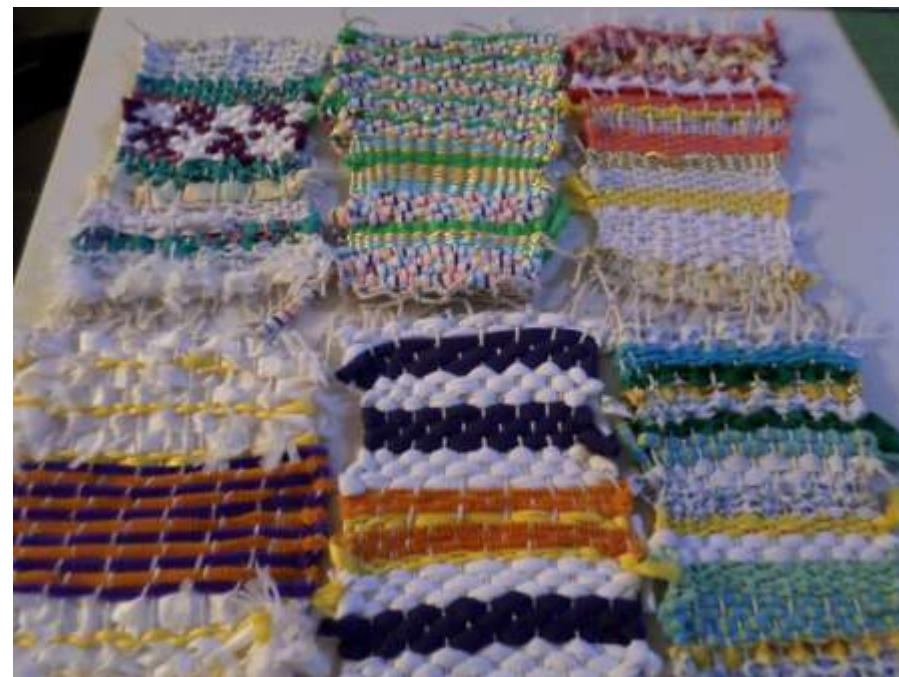
Βιωματικό Εργαστήρι «Υφανση σε χαρτόκουτο»