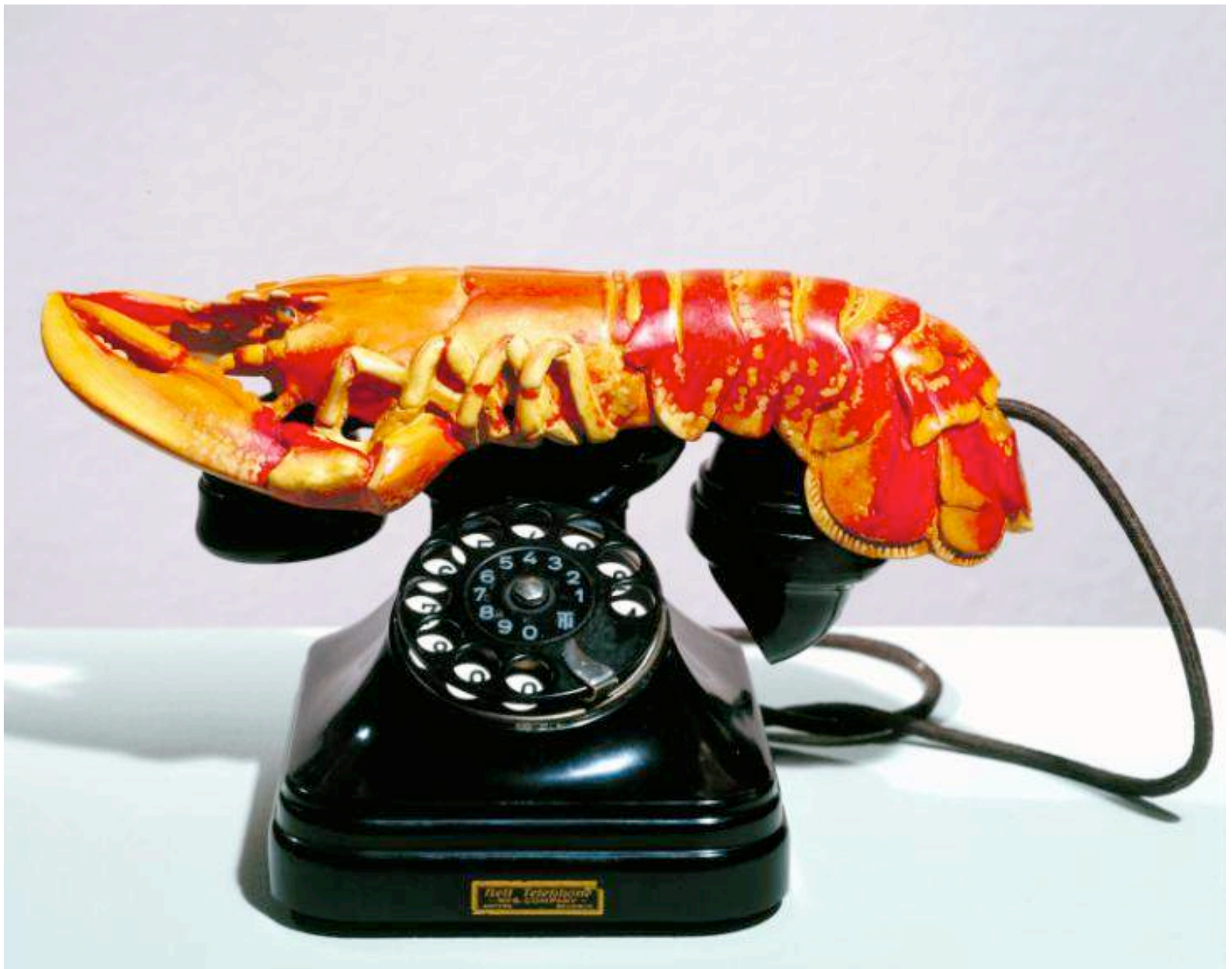
Salvador Dalí, «Τηλέφωνο αστακός», 1936