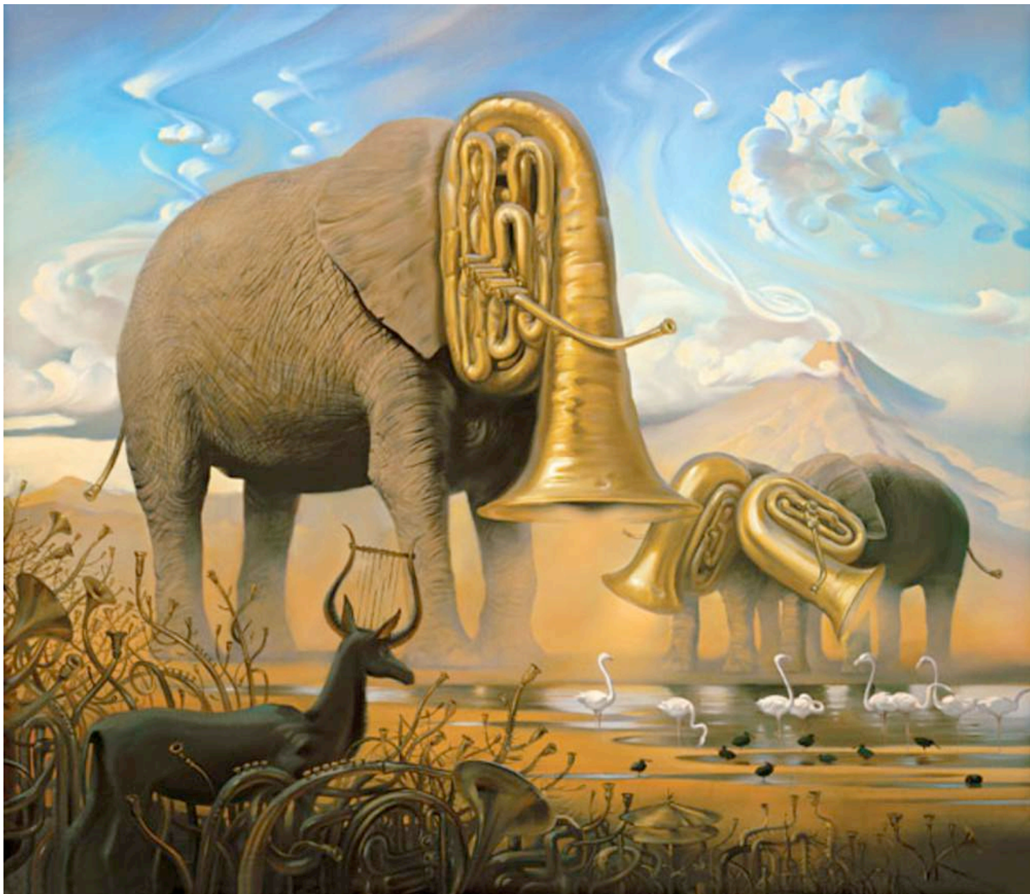
Vladimir Kush, «Αφρικανική Σονάτα»,