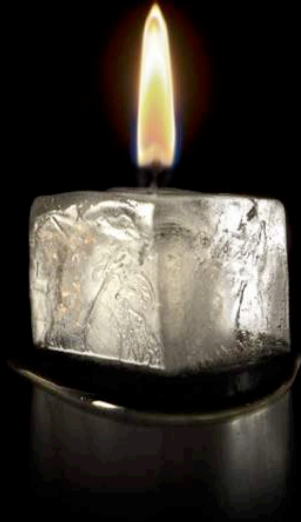
Giuseppe Colarusso, "Unlikely... but not Impossible" / «Απίθανο ... αλλά όχι αδύνατο», Σειρά ψηφιακά επεξεργασμένων φωτογραφιών