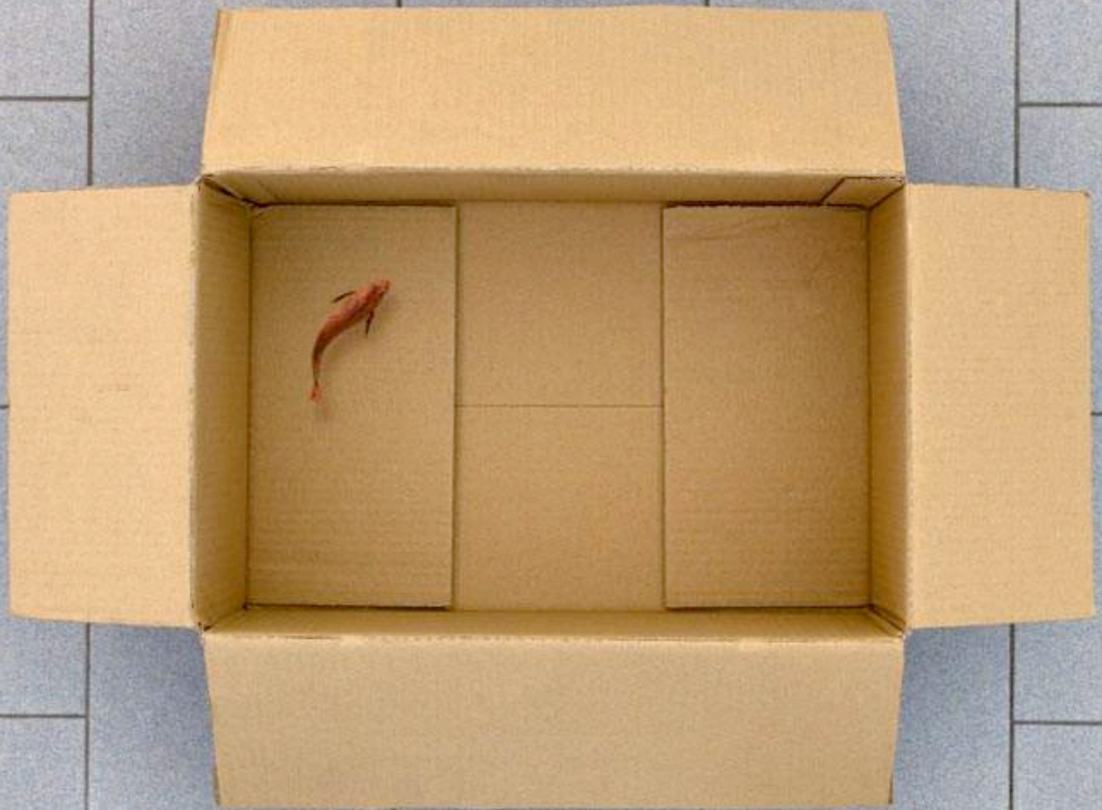
Giuseppe Colarusso, "Unlikely... but not Impossible" / «Απίθανο ... αλλά όχι αδύνατο», Σειρά ψηφιακά επεξεργασμένων φωτογραφιών