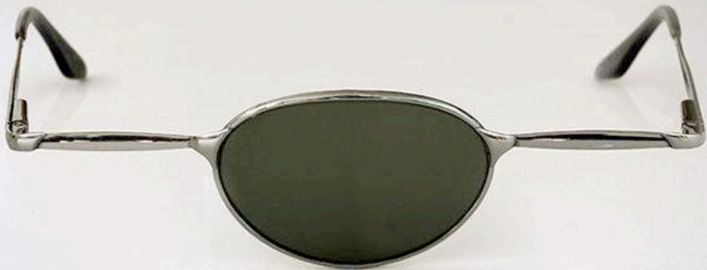
Giuseppe Colarusso, "Unlikely... but not Impossible" / «Απίθανο ... αλλά όχι αδύνατο», Σειρά ψηφιακά επεξεργασμένων φωτογραφιών