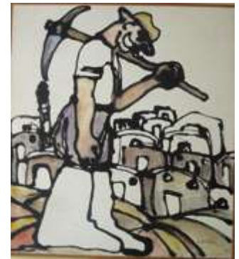
Λευτέρη Σεργίου, Σύνθεση με φιγούρα- Το βάρος, 1977