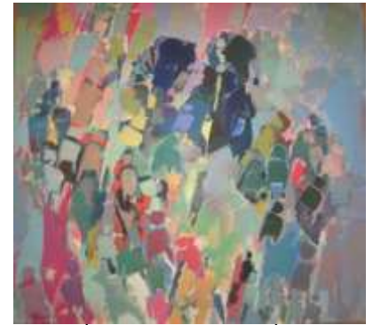
Επιστροφή γυναικών, 1989

Περιγραφή: Ενώ τα παιδιά βρίσκονται ακόμη μπροστά στο έργο του Σεργίου, τους δίνεται η οδηγία να ζωγραφίσουν με μολύβι στα εικαστικά τους ημερολόγια μια ανθρώπινη φιγούρα που να έχει αρκετές λεπτομέρειες π.χ. να κρατά τη τσάντα της, να φορά καπέλο, ζώνη κτλ. Κάθε φορά που θα χτυπά η κουδούνα θα αφαιρούν μια λεπτομέρεια. Π.χ. στο πρώτο χτύπημα θα σβήσουν το καπέλο, στο δεύτερο θα σβήσουν τα χαρακτηριστικά του προσώπου, στο τρίτο χτύπημα θα σβήσουν τα μαλλιά κτλ. Ακολουθώντας χρωματίζουν με ένα χρώμα μαρκαδόρου τη φιγούρα τους και την κόβουν. Τίθεται ο προβληματισμός: Σε ποιο έργο διακρίνουν αφαιρετικές φιγούρες; Ψάχνουν στον χώρο και εντοπίζουν το έργο που έχει αφαιρετικές φιγούρες.