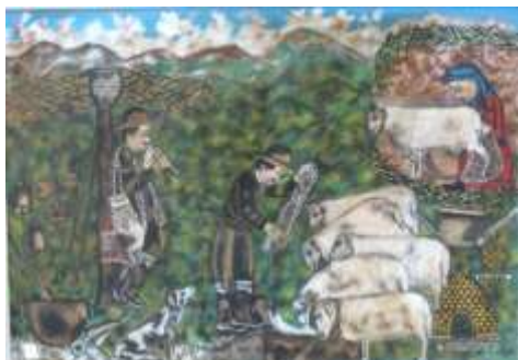
Μιχαήλ Κκάσιαλος, «Ποιμενική Σκηνή» (20ος αιώνας)

Τα έργα στα οποία επικεντρώνονται οι δραστηριότητες είναι: