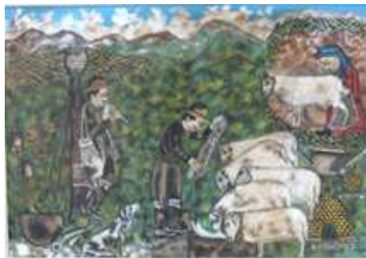
Μιχαήλ Κκάσιαλος, Ποιμενική Σκηνή, 20ος αιώνας

Υλικά: καλάθια (όσα και οι ομάδες), μπότα (ποΐνα), φλογέρα (πιθκιαύλι), ψάθινο καπέλο, προβιά, μαντήλι (τσιεμπέρι), κολότζι, βούρκα (τσάντα), κουδούνι, γυναικεία ποδιά, ψάθινο καλάθκι (ταλάρι), κουτάλα