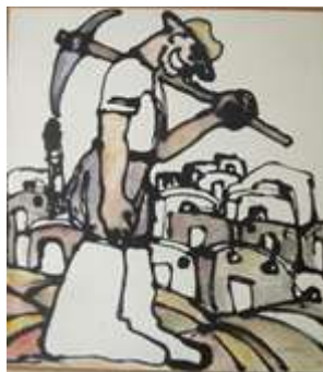
Λευτέρης Σεργίου, «Σύνθεση με φιγούρα - Το βάρος» (1977)