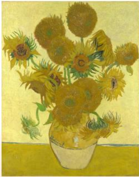
National Gallery, Λονδίνο