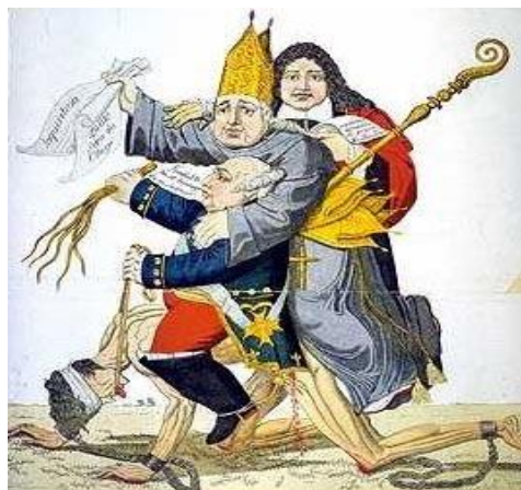
Η «τρίτη τάξη» βρίσκεται αλυσοδεμένη και επάνω της υπεύθουν ευγενείς, κληρικοί και ο Λουδοβίκος XVI

Η Δυτική κοινωνία άλλαξε ριζικά τον 18 ο αι., εξαιτίας της ανάπτυξης του εμπορίου αλλά και εξαιτίας της βιομηχανικής επανάστασης. Πρωταγωνιστής και ρυθμιστικός παράγοντας των αλλαγών αυτών υπήρξε η αστική τάξη. Η γαλλική κοινωνία όμως, εξακολουθούσε να είναι αριστοκρατική και φεουδαρχική, χωρισμένη σε τρεις τάξεις που υφίσταντο από την περίοδο του Μεσαίωνα: τον Κλήρο , τους Ευγενείς και την Τρίτη Τάξη . Οι δύο πρώτες κατείχαν όλα τα προνόμια, ενώ η τελευταία είχε μόνο υποχρεώσεις.