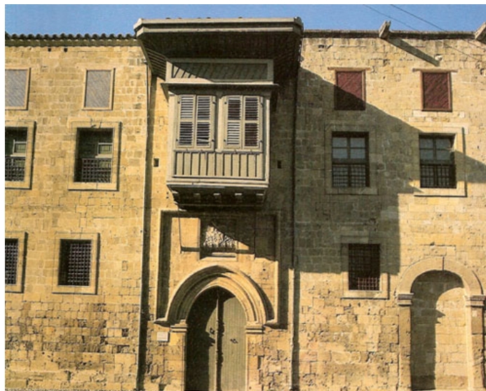
Το αρχοντικό του Δραγομάνου της Κύπρου Χατζηγεωργάκη Κορνέσιου

Σε ό,τι αφορά την αστική αρχιτεκτονική, σημαντικό δείγμα αποτελεί το κονάκι του Κύπριου δραγομάνου Χατζηγεωργάκη Κορνέσιου στη Λευκωσία.