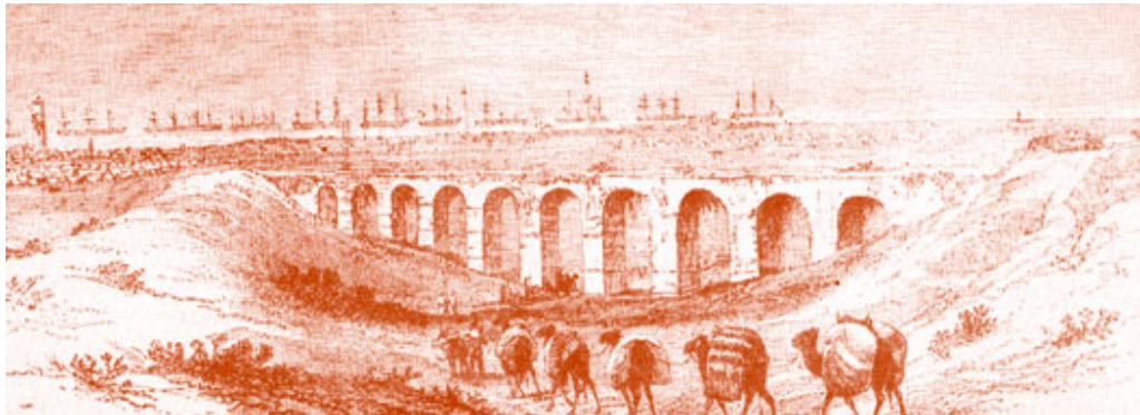
Το υδραγωγείο « Καμάρες » της Λάρνακας (Γκραβούρα του 1878)

Είναι γεγονός ότι ήταν μεγάλη η αδιαφορία που επιδείκνυε η τουρκική κυβέρνηση στην Κύπρο για κατασκευή κοινωφελών έργων. Το μοναδικό μεγάλο κοινωφελές έργο που κατασκευάστηκε κατά την περίοδο της Τουρκοκρατίας ήταν το υδραγωγείο της Λάρνακας, που ήταν πρωτοβουλία του Αμπού Μπεκήρ (1750), του οποίου η διακυβέρνηση υπήρξε το μόνο φωτεινό διάλειμμα κατά την περίοδο αυτή.