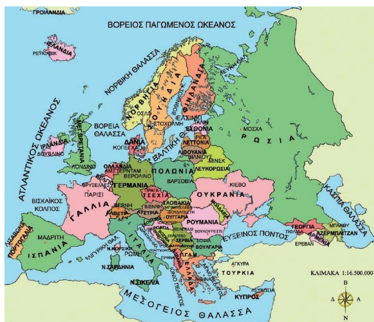
Εικόνα 29. 1: Πολιτικός χάρτης της Ευρώπης κατά το έτος 2006-2007

http://digital.alithia.com.cy/digital/arxeiopdf/2012-10-21.pdf (διασκευή) 21 Οκτωβρίου 2012 • • 7ΜΕΡΕΣ