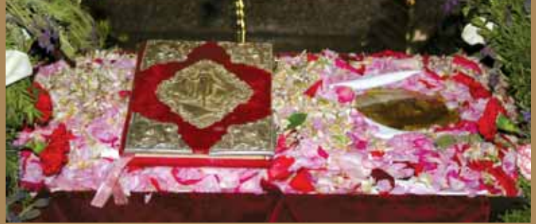
Εικ.38 Ὁ Ἐπίσκοπος Νεαπόλεως κ. Πορφύριος, προΐσταται τῆς Ἀκολουθίας τοῦ Ἐπιταφίου στὸν Ἱερό Ναὸ Ἁγίου Δημητρίου, Λευκωσία.

Μεγάλη Παρασκευὴ Ἑσπέρας, Ἐγκώμια, Στάσις Τρίτη, Ἦχος γ΄