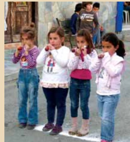
Εικ.66,67,68 Παραδοσιακὰ Πασχαλινὰ Παιγνίδια στὸ Ὑπαιθρο.