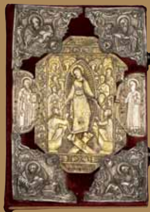
Εἰκ.52 Λιτανεία καὶ ἀνάγνωση τοῦ ἀναστάσιμου Εὐαγγελίου ἐπὶ τῆς Ἁγίας Τραπεζῆς, ἀπὸ τὴν Α.Μ. τὸν Ἀρχιεπίσκοπο Κύπρου κ.κ. Χρυσόστομον Β΄ στὸν Καθεδρικό Ναὸ Ἁγίου Ἰωάννη, Λευκωσία.