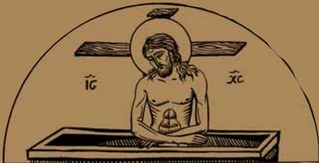
Εικ.33 Η ΠΕΤΡΙΝΗ ΚΑΡΔΙΑ ΜΑΣ, ΤΑΦΟΣ ΤΟΥ ΧΡΙΣΤΟΥ

«Ω γλυκύ μου Ξαρ, γλυκύτετόν μου τέκνον, πού ΐδου σου τὸ κάλλος;»