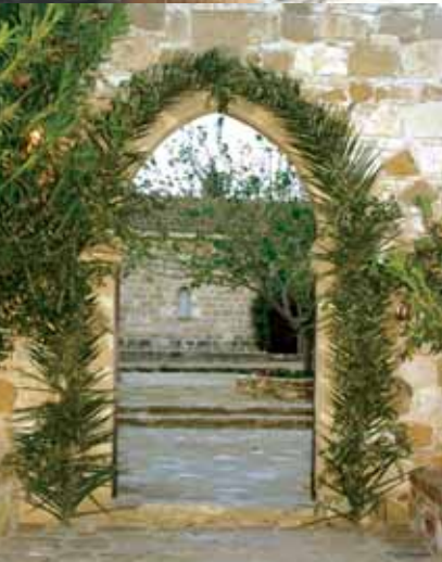
Εἰκ.15 Ἡ Πύλη τῆς Ἱεράς Μονῆς Ἁγίου Γεωργίου Μαυροβονίου, Τροῦλλοι, στολισμένη με βαΐα.