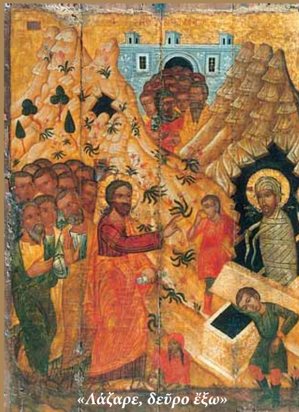
«Λάζαρε, δεῦρο ἔξω»

Εἰδικὴ ἀναφορά γίνεται γιὰ τὴν Κύπρο, στὴν ὁποία κατέφυγε ὁ ἅγιος, ὅπου στὸ Κίτιο χειροτονήθηκε ἐπίσκοπος ἀπὸ τοὺς Ἀποστόλους. Ἐκεῖ εὑρίσκεται καὶ ὁ δεῦτερος τάφος του στὸν περικαλλὴ βυζαντινὸ ναὸ πού εἶναι ἀφιερωμένος σ' αὐτόν.