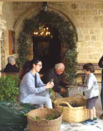
Εἰκ.14 Οἱ πιστοὶ ἐτοιμάζουν τὰ βαΐα γιὰ τὸ στολισμὸ τοῦ Ἱεροῦ Ναοῦ Παναγίας Χρυσалиνιώτισσας στὴν Παλιὰ Λευκωσία.

Ὁ Ἰησοῦς ἐξεκίνησε ἐκ Βηθανίας διὰ τὰ Ἱεροσόλυμα. Ὅταν ἔφθασε πλησίον, λέγει εἰς δύο ἐκ τῶν μαθητῶν: Πηγαίνετε εἰς τὴν ἀπέναντι κώμην καὶ θὰ εὑρετε ἐμπρὸς σας μίαν ὄνον μετὰ τοῦ πάλου αὐτῆς. Λάβετε τὸν πᾶλον καί, ἂν σὰς ἐρωτήσῃ κανεὶς, εἶπατε, ὅτι ὁ Διδάσκαλος ἔχει ἀνάγκην αὐτοῦ. Οἱ δύο μαθηταὶ μετέβησαν καὶ ἔφεραν τὸν πᾶλον. Ἔθεσαν ἐπὶ τῆς ράχεως αὐτοῦ ἱμάτια, ἐκάθισεν ἐπ' αὐτοῦ ὁ Ἰησοῦς καὶ ἤρχισαν νὰ προχωροῦν πρὸς τὴν Ἱερουσαλήμ. Τοιοῦτοτρόπως ἐξεπληρώθη ἡ προφητεία τοῦ προφήτου Ζαχαρίου, ὁ ὁποῖος ἔγραψεν: «Εἶπατε εἰς τὴν θυγατέρα Σιών: Ἴδου ὁ Βασιλεὺς σου ἔρχεται εἰς σὲ καθήμενος ἐπὶ πάλου ὄνου». Πολλοὶ κάτοικοι τῆς Ἱερουσαλήμ καὶ πολλοὶ προσκυνηταί, ὅταν ἤκουσαν, ὅτι ἔρχεται ὁ Ἰησοῦς, ἐξῆλθαν νὰ τὸν προῦπαντήσουν. Ἄλλοι ἐκράτουν βαΐα, ἤτοι φύλλα φοινίκων, ἄλλοι ἔστρωναν εἰς τὸν δρόμον ὑφάσματα καὶ κλάδους δένδρων καὶ ἔκραζαν: Ὡσαννά, εὐλογημένος ὁ ἐρχόμενος ἐν ὀνόματι Κυρίου! Τοιοῦτοτρόπως δέ, ἐν μέσῳ τοῦ ἐνθουσιᾶντος πλήθους, εἰσήλθεν ὁ Ἰησοῦς θριαμβευτικῶς εἰς τὴν Ἱερουσαλήμ. Ἡ εἴσοδος αὐτῆ πανηγυρίζεται ὑπὸ τῆς Ἐκκλησίας μας τὴν Κυριακὴν τῶν Βαΐων, μίαν Κυριακὴν πρὸ τοῦ Πάσχα, ὅτε διανέμονται βαΐα εἰς τοὺς χριστιανούς.