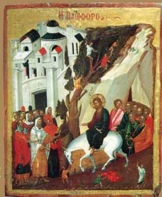
Εἰκ.13 Ἡ Βαΐοφόρος. 41.5 X 34 ἐκ. Ἐκκλησία τοῦ Ἁγίου Σωζομένου, Γαλάτα.

«Ἐρχόμενος ὁ Κύριος πρὸς τὸ ἐκούσιον πάθος, τοῖς ἀποστόλοις ἔλεγεν ἐν τῇ ὁδῷ· ἰδου ἀναβαίνομεν εἰς Ἱεροσόλυμα καὶ παραδοθήσεται ὁ Υἱὸς τοῦ ἀνθρώπου, καθὼς γέγραπται περὶ αὐτοῦ...».