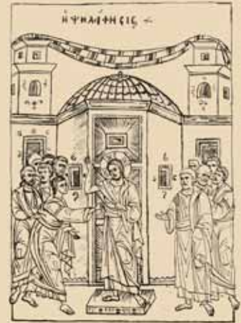
Εἰκ.57 Ἡ Ψηλάφηση

Ἡ πρώτη Κυριακὴ μετὰ τὸ Πάσχα εἶναι ἡ Κυριακὴ τοῦ Θωμᾶ . Εἶναι ἡ παρουσία τοῦ Χριστοῦ σὲ μᾶς, συνηγμένους στὴν Ἐκκλησία τῶν «θυρῶν κεκλεισμένων», καὶ μᾶς δείχνει πῶς ἐμεῖς πρέπει νὰ ἀνταποκριθοῦμε σ' αὐτὴν τὴν παρουσία καὶ πῶς πρέπει νὰ συναντήσουμε τὸν Χριστό.