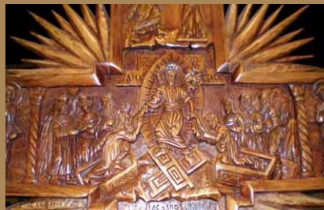
Εἰκ.47 Ἡ Ἀνάστασις, λεπτομέρεια ἀπὸ ξυλόγλυπτο Σταυρό.

ΚΥΡΙΑΚΗ ΤΟΥ ΠΑΣΧΑ, ΟΡΘΟΣ Ἐξαποστολιάριον αὐτόμελον, Ἦχος β'