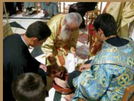
Εἰκ.23 Άναπαράσταση τοῦ Νιπτήρος στὸν Ίερὸ Ναὸ Άγίου Άρσενίου Καππαδόκη στὴν Κυπερούντα.