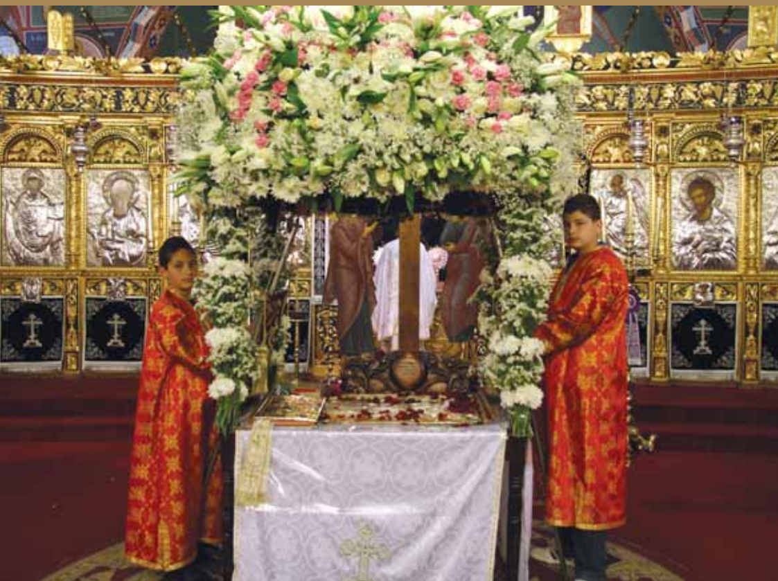
Εικ.41 Παπαδάκια (αγόρια ντυμένα με άμφια) στον Έπιτάφιο στον Ίερό Ναό Αγίου Δημητρίου, Λευκωσία.