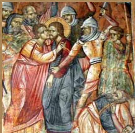
Εἰκ.22 Ἡ Προδοσία, Τοιχογραφία, Ίερὸς Ναὸς Άγίας Παρασκευῆς, Γεροσκήπου.