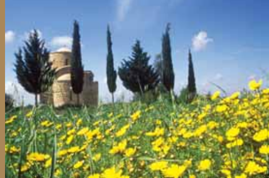
Εικ.9 Κίτρινες μαργαρίτες (Σιμιλλοῦδκια)

Τὸ « Τραγούδι τοῦ Λαζάρου » τραγουδιέται ἀπὸ παιδιά ἀλλὰ καὶ ἀπὸ μεγάλους, τὸ Σάββατο τοῦ Λαζάρου ἢ τὸ ἀπόγευμα τῆς προηγούμενης μέρας, τῆς Παρασκευῆς, μετὰ τὴν ἀκολουθία τοῦ Μικροῦ Ἀποδείπνου καὶ τοῦ Κανόνος τοῦ Ἁγίου Λαζάρου στὴν ἐκκλησία. Ταυτόχρονα ἐκτελεῖται δρώμενο μὲ τὴν ἀναπαράσταση τῆς Ἔγερσης τοῦ Λαζάρου ἀπὸ παιδιά, ἐνῶ οἱ συμμετέχοντες κρατοῦν λουλούδια πού συμβολίζουν τὸ Λάζαρο, ὅπως λαζάρους καὶ σίμιλλα. Τὸ τραγούδι φέρνει τὸ χαρμόσυνο μήνυμα τοῦ ἐρχομοῦ τῆς ἀνοιξῆς πού ἔφερε τὸ μήνυμα τῆς ἀνάστασης τοῦ Λαζάρου καὶ τὴν προαγγελία τῆς κοινῆς ἀναστάσεως.