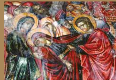
Εικ.32 Τοιχογραφία, Ἱερός Ναὸς Ἁγίας Παρασκευῆς, Γεροσκήπου.