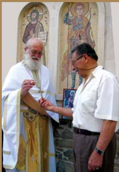
Εἰκ.54 Τσουγκρίσμα κόκκινων αὐγῶν μὲ τὸν ἀναστάσιμο χαιρετισμό: «Χριστὸς Ἀνέστη!» Ἄληθῶς Ἀνέστη ὁ Κύριος».