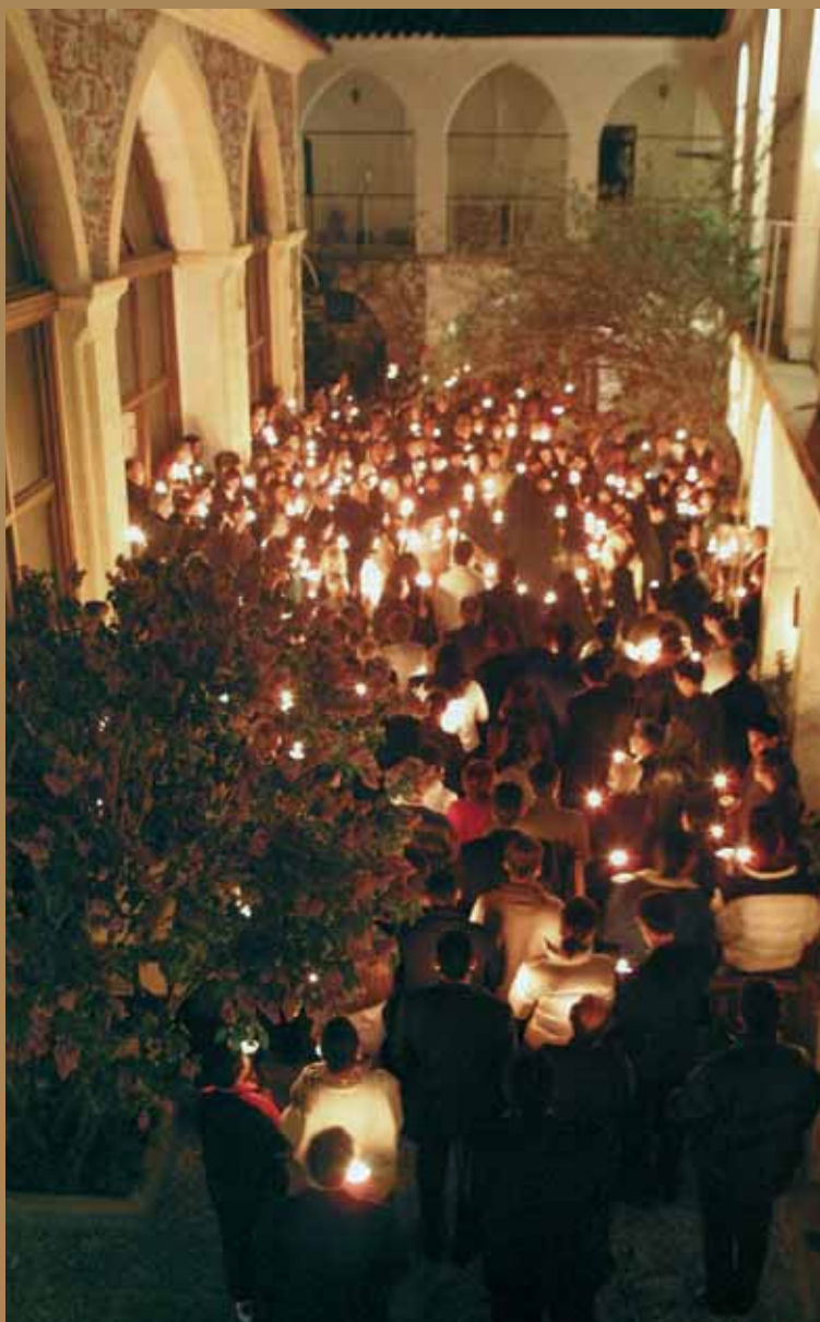
Εικ.49 Ἀκολουθία Ἀναστάσεως, στὴν Ἱερὰ Μονὴ Μαχαίρᾶ, Λαζαριάς.

«Μὲ τὸ φῶς νὰ τὴν πλημμυρίζει ἀσταμάτητα, ἢ Κύπρος εἶναι ἓνα ἰδιαίτερο νησι. Οἱ κάτοικοι τῆς διατηροῦν ἀκόμη τὶς θρησκευτικὲς παραδόσεις. Καὶ ὁ ἑορτασμὸς τῆς Ἀνάστασης ἔχει κάτι ἀπὸ τὴν ψυχὴ τους».