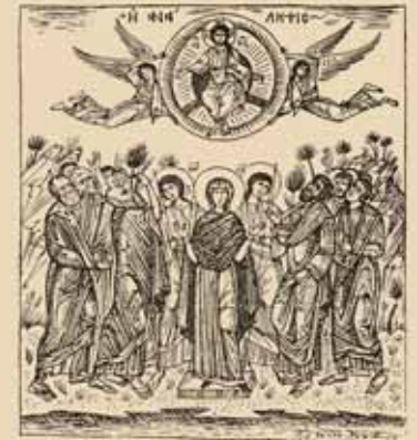
Εἰκ.58 Ἡ Ἀνάληψις

Ἡ περίοδος αὐτὴ εἶναι μιὰ ἰδιαίτερη εὐκαιρία ποῦ μᾶς δίνει ἡ Ἐκκλησία γιὰ νὰ συννευρεθοῦμε μὲ τὸν ἀναστημένο Χριστό, νὰ τὸν ἀγαπήσουμε καὶ νὰ γνωρίσουμε τὴν ἀπέραντη δύναμή Του τόσο πάνω στὸν ὑλικὸ ὅσο καὶ πάνω στὸν πνευματικὸ κόσμο. Ἡ Ὁρθόδοξη πνευματικὴ παράδοση δὲν ζητάει ἀπὸ τὸν ἄνθρωπο νὰ δεχθεῖ κάτι ποῦ δὲν ἔχει διαπιστώσει, ἀλλὰ τοῦ ζητάει νὰ ἔλθει καὶ νὰ δεῖ μὲ τὰ ἴδια του τὰ μάτια.