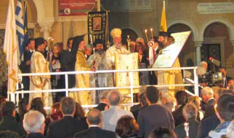
Εικ.48 Ἡ Τελετὴ τῆς Ἀναστάσεως (Καλὸς Λόγος) στὸν περίβολο τοῦ Καθεδρικοῦ Ναοῦ Ἁγίου Ἰωάννη Θεολόγου, Λευκωσία.

«Μὲ τὸ φῶς νὰ τὴν πλημμυρίζει ἀσταμάτητα, ἢ Κύπρος εἶναι ἓνα ἰδιαίτερο νησι. Οἱ κάτοικοι τῆς διατηροῦν ἀκόμη τὶς θρησκευτικὲς παραδόσεις. Καὶ ὁ ἑορτασμὸς τῆς Ἀνάστασης ἔχει κάτι ἀπὸ τὴν ψυχὴ τους».