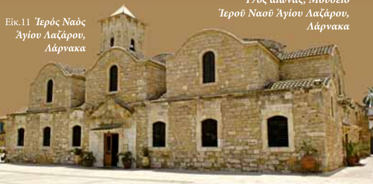
Εικ.11 Ἱερός Ναός Ἁγίου Λαζάρου, Λάρνακα