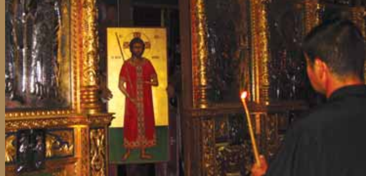
Εἰκ.12 «Ἴδου ὁ Νυμφίος ἔρχεται ἐν τῷ μέσῳ τῆς νυκτός».