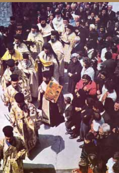
Εἰκ.53 Λιτανεία κατὰ τὴν ἡμέραν τοῦ Πάσχα στὴν Ἱερὰ Μονὴ Κύκκου.