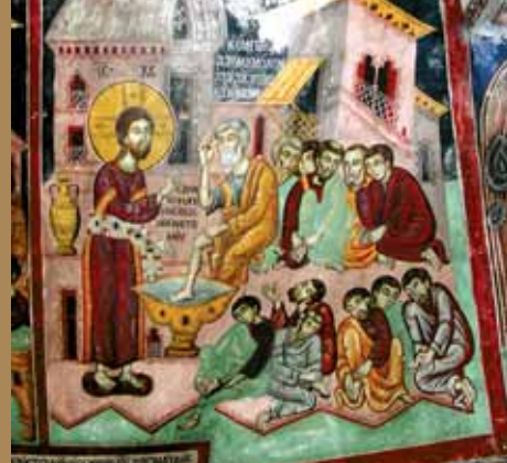
Εἰκ.20 Ὁ Νιπτήρ, Τοιχογραφία, Έγκλειστρα, Ίερὰ Μονή Άγίου Νεοφύτου, Τάλα.

Ή Μ. Πέμπτη εἶναι ή ημέρα τῆς παραδόσεως τοῦ Μυστηρίου τῆς Θείας Εὐχαριστίας καὶ διὰ τοῦτο ό Έσπερινός τῆς ημέρας αὐτῆς εἶναι συνυφασμένος μετὰ Θ. Λειτουργίας (τῆς τοῦ Μ. Βασιλείου). Ή Λειτουργία αὐτή τελεῖται κατὰ τὰς πρωϊνάς ώρας.