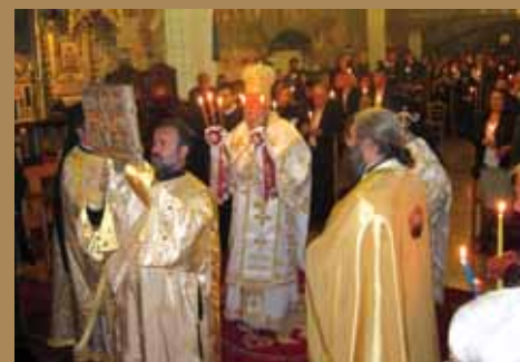
Εικ.50 Ἡ Α. Μ. ὁ Ἀρχιεπίσκοπος Κύπρου κ.κ. Χρυσόστομος Β' τελεῖ τὴν Ἀναστάσιμη Θεία Λειτουργία, μετὰ τὴν τελετὴ τῆς Ἀναστάσεως, στὸν Καθεδρικό Ναὸ Ἁγίου Ἰωάννη, Λευκωσία.

«Πάσχα ἱερὸν ἡμῖν σήμερον ἀναδέδεικται· πάσχα καινόν, ἅγιον· πάσχα μυστικόν· πάσχα πανσεβάσμιον· πάσχα Χριστὸς ὁ Λυτρωτῆς· πάσχα ἄμωμον· πάσχα μέγα· πάσχα τῶν πιστῶν· πάσχα τὸ πύλας ἡμῖν τοῦ Παραδείσου ἀνοῖξαν· πάσχα, πάντας ἀγιάζον πιστούς».