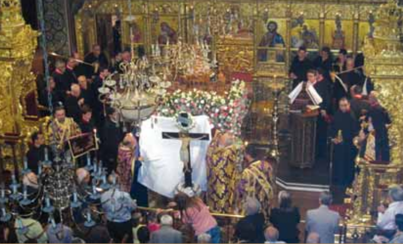
Εικ.29 Ὁ Ἑσπερινὸς τῆς Ἀποκαθλώσεως, χοροστατοῦντος τοῦ Μητροπολίτου Κύκκου καὶ Τηλλυρίας κ. Νικηφόρου στὸν Ἱερό Ναὸ Ἁγίου Προκοπίου, Μετόχιον Κύκκου, Λευκωσία.