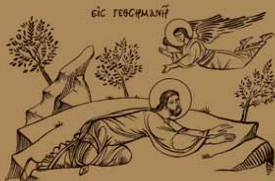
Εἰκ.24 Ἡ Άγωνία ή προσευχή τοῦ Χριστοῦ έν τῷ Κήπῳ τῆς Γεθσημανῆ.