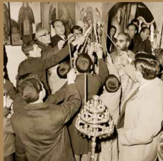
Εικ.1 Άνάστασις στὸν Ἱερό Ναὸ Ἁγίου Δημητρίου Λευκωσίας, 1968

«Δεῦτε λάβετε Φῶς, ἐκ τοῦ Ἄνεσπέρου Φωτὸς καὶ δοξάσατε Χριστὸν τὸν Ἀναστάντα ἐκ νεκρῶν»