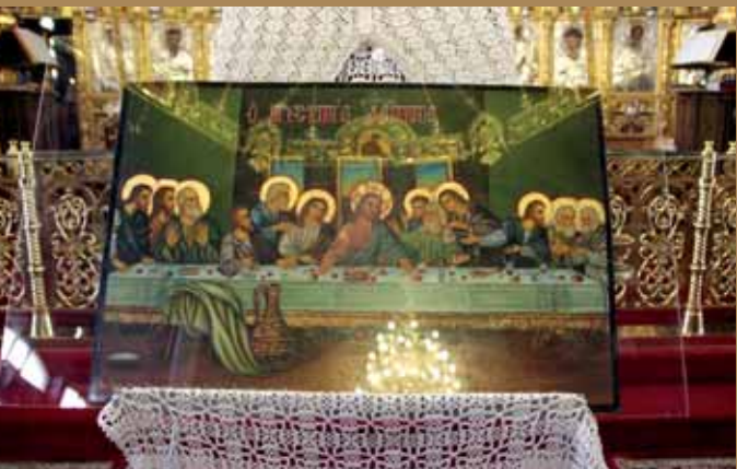
Εἰκ.21 Ὁ Μυστικὸς Δείπνος Ίερὸς Ναὸς Άγίου Δημητρίου, Λευκωσία