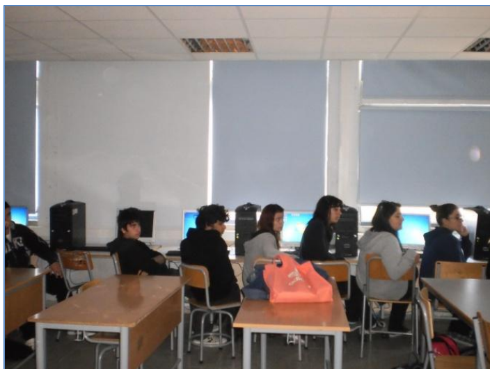
Εικόνα 2: Οι μαθητές καθώς δουλεύουν στη διαδικτυακή πλατφόρμα ΣΤΟΧΑΣΜΟΣ, στο στάδιο της διερώτησης

Στο στάδιο της διερώτησης, οι μαθητές καλούνται να μελετήσουν όλες τις πληροφορίες που υπάρχουν στην διαδικτυακή πλατφόρμα ΣΤΟΧΑΣΜΟΣ σχετικά με το φυσικό αέριο (τι είναι, πώς σχηματίζεται, πώς εξορύσσεται, πού χρησιμοποιείται), καθώς επίσης και τα πλεονεκτήματα και τα μειονεκτήματα που πιθανόν να προκύψουν από τη χρήση του ως ενεργειακό πόρο στο φυσικό περιβάλλον και στην καθημερινή ζωή. Συγκεκριμένα, στο στάδιο αυτό οι μαθητές συλλέγουν τις πληροφορίες που χρειάζονται μέσα από μια ποικιλία πολυμεσικών πηγών (π.χ. φωτογραφίες, βίντεο, διαγράμματα, άρθρα) μέσα από το διαδικτυακό περιβάλλον διερεύνησης και στη συνέχεια οργανώνουν και ερμηνεύουν τα δεδομένα αυτά στον αναστοχαστικό «Φάκελο Εργασίας» στην πλατφόρμα ΣΤΟΧΑΣΜΟΣ.