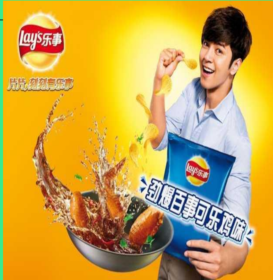
Και γιατί έτσι;