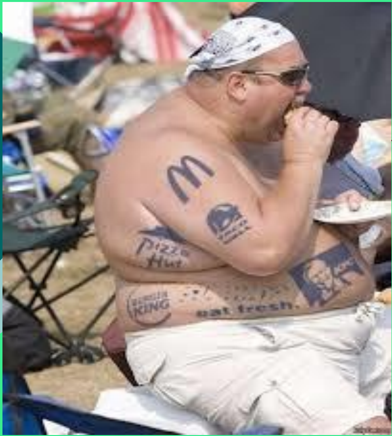
Και όχι έτσι;